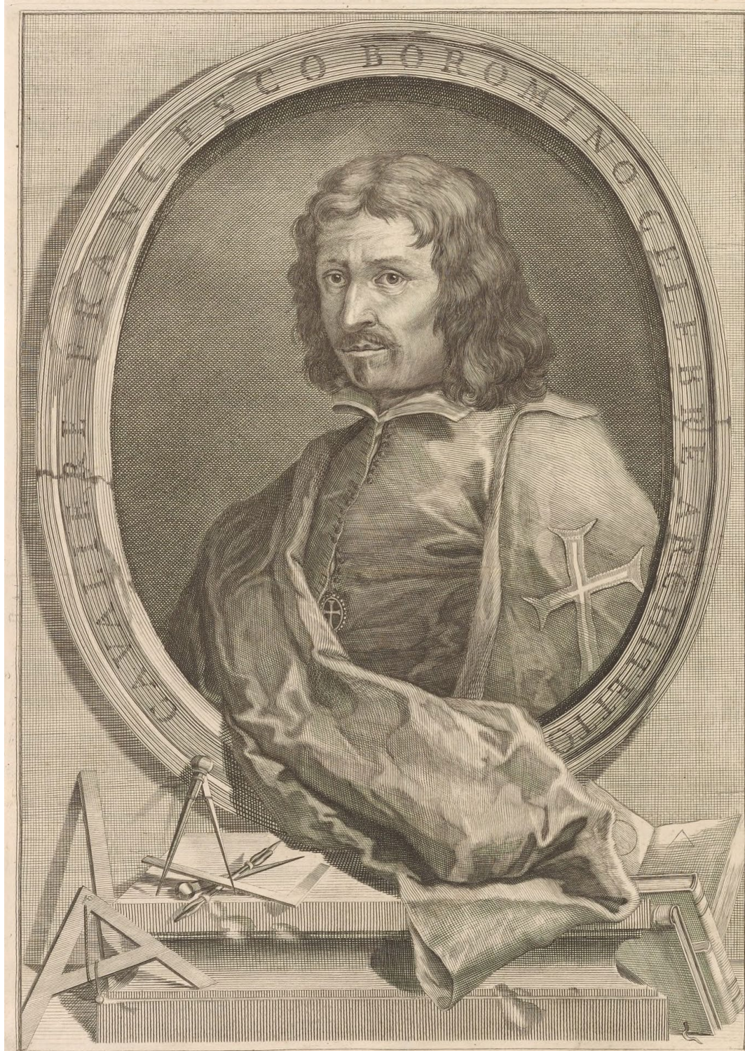
Anonimo, ritratto di Francesco Borromini, incisione (da Opus architectonicum equitis Francisci Borromini , frontespizio, Giannini, Roma, 1725).