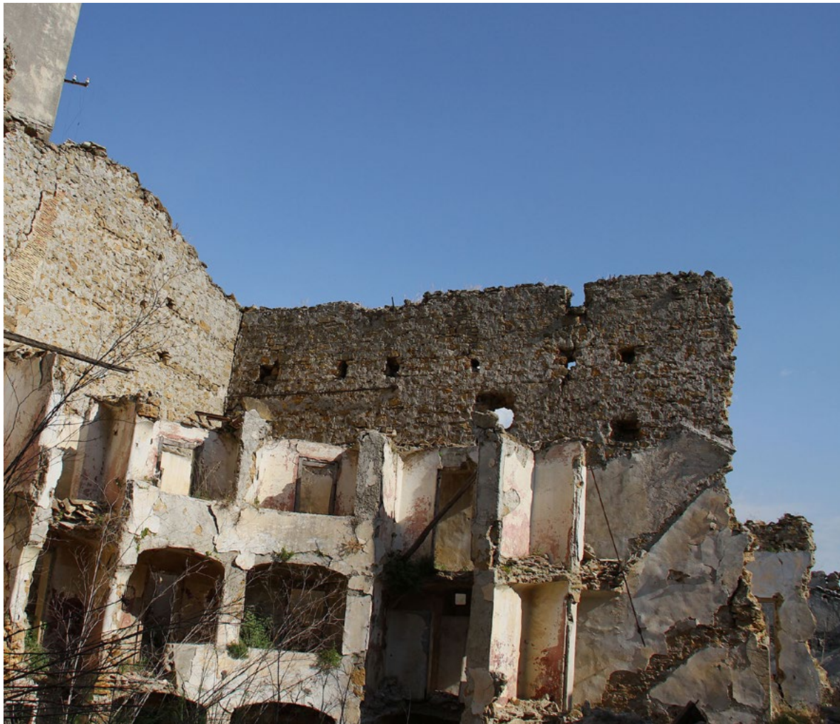
Figura 11. Ruedi di Poggioreale (Trapani), vista sui resti del teatro comunale.