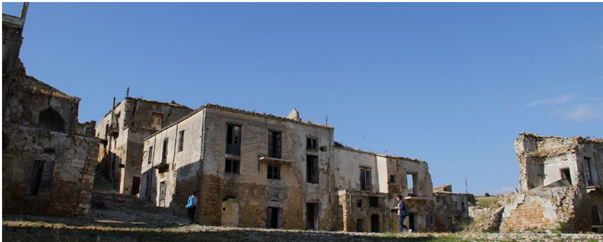
Figura 10. Ruedri di Poggioreale (Trapani), vista sulla piazza Elimo.

delle parti terminali delle murature e delle superfici di sedime e la conservazione delle superfici della minima preesistenza 35 , per rallentare sensibilmente il «processo di ruderizzazione» a cui le Linee Guida del 2012 non pongono attenzione. Anche per questa parte del paese si desidera garantire l'accessibilità e assicurare la manutenzione 36 .