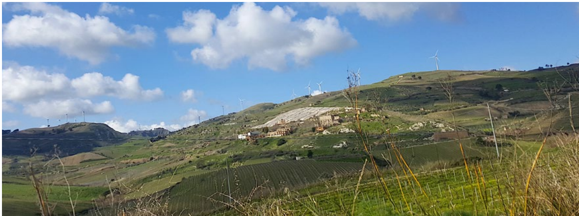
Figura 1. Grande Cretto di Gibellina (Trapani) e rovine del vecchio paese.

impreciso e indeterminato, dove architettura e città restano separati» 9 (figg. 1-3). Ludovico Corrao, sindaco di Gibellina, intuì che l'arte poteva far dialogare l'architettura e gli spazi urbani, colmando la distanza creatasi nella nuova città. Per tale obiettivo invitò artisti quali, ad esempio, Piero Consagra, Mimmo Paladino e Alberto Burri. Quest'ultimo, visitando, nel 1981, con Corrao la nuova Gibellina non provò emozioni (come, nonostante tutto, continua a non trasmetterle a molti), e volle invece essere condotto nell'antico centro distrutto. Burri fra le rovine di Gibellina invece si commosse e pertanto preferì «lavorare sulle macerie a cielo aperto della vecchia città piuttosto che donare un suo contributo per la ricostruzione di quella nuova. Di lì l'idea del Grande Cretto di Gibellina : una enorme gettata di cemento bianco che, incorporando le macerie del terremoto, avrebbe dovuto ricoprire la planimetria della città distrutta dal sisma» 10 . Il Grande Cretto di Burri 11 , con l'attuale superficie di 86.000,0 metri 12 ,