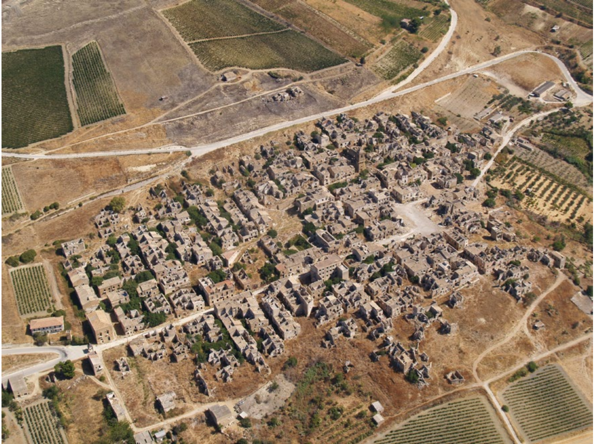
Figura 6. Ruedi di Poggioreale (Trapani).