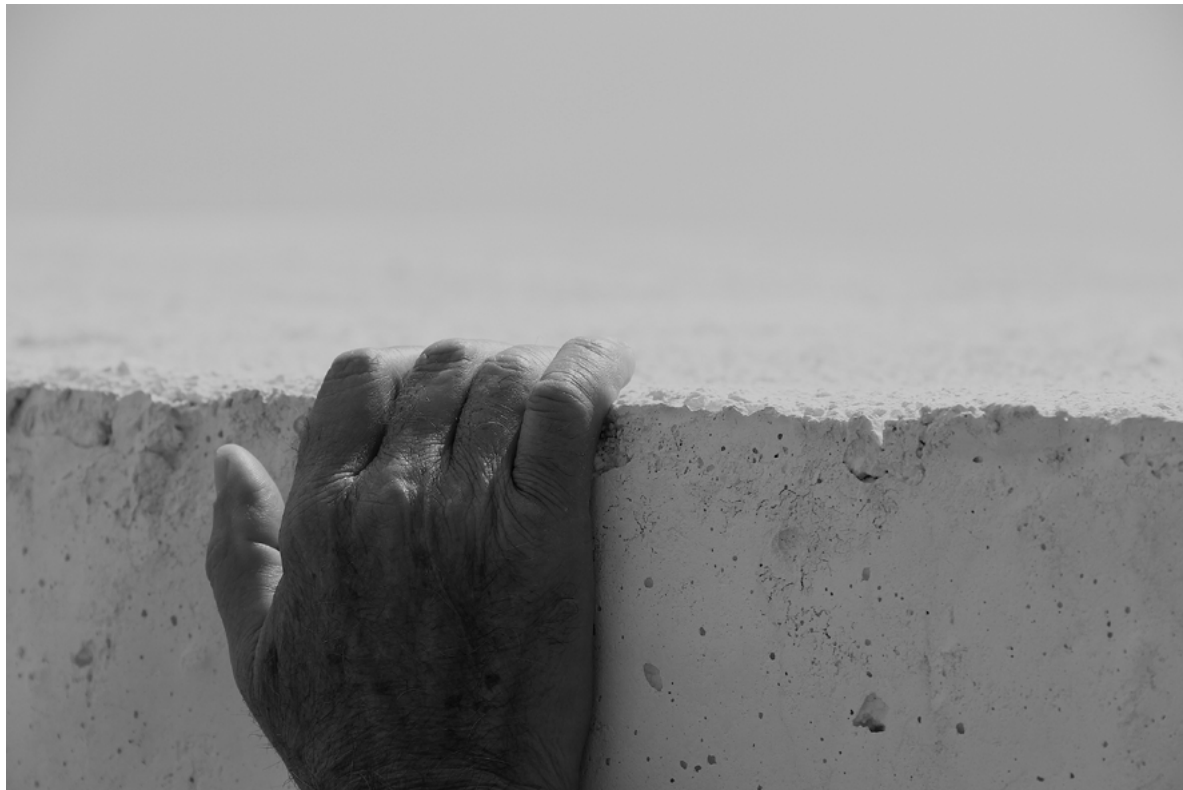
Figura 4. Grande Cretto di Gibellina (Trapani), anziano del vecchio paese che appoggia una mano sul cretto, quasi a volere accarezzare i resti della sua casa, che però non riesce ad individuare.