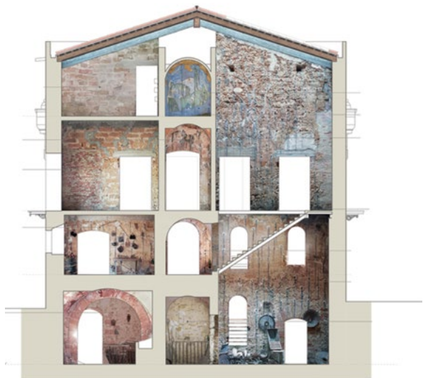
Figure 7-8. Ruleri di Poggioreale (Trapani), prospetto orientale e sezione trasversale di palazzo Agosta (disegni di F. Coco, 2018).