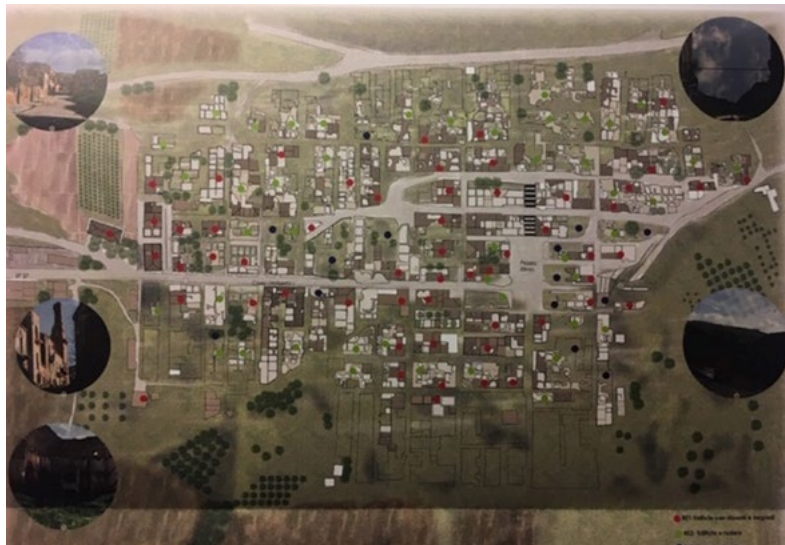
Figura 9. Planimetria dei ruderi di Poggioreale (Trapani), con la divisione in zone “RE1 Edifici con dissesti e degradi; RE2 Edificio a rudere; e RE3 Traccia di sedime (disegno G. Buttitta, 2019).

che è pervenuto di Poggioreale antico. Oramai tutto è storicizzato (perfino l’edificio finito di costruire l’anno precedente al sisma), ma che oggi è testimonianza di quell’evento in quanto ne porta i segni. Dunque, ad esempio, i resti della chiesa Madre (sec. XVII), il palazzo Agosta (metà sec. XIX), la caserma dei Carabinieri (metà sec. XX), così come l’area di sedime di un edificio (sec. XX), sono un assieme alle sedi viarie, alle piazze e al paesaggio circostante, e costituiscono oramai l’antico centro di Poggioreale. Partendo da questa considerazione sono state sviluppate alcune ricerche-tesi. La prima ha indagato e poi dimostrato come è ancora possibile mettere in atto i principi contemporanei del restauro, applicandoli al palazzo Agosta di Poggioreale 30 , preso però ad esempio di tanti altri casi sui quali ancora si può, e si deve, correttamente intervenire nei paesi colpiti dal sisma.