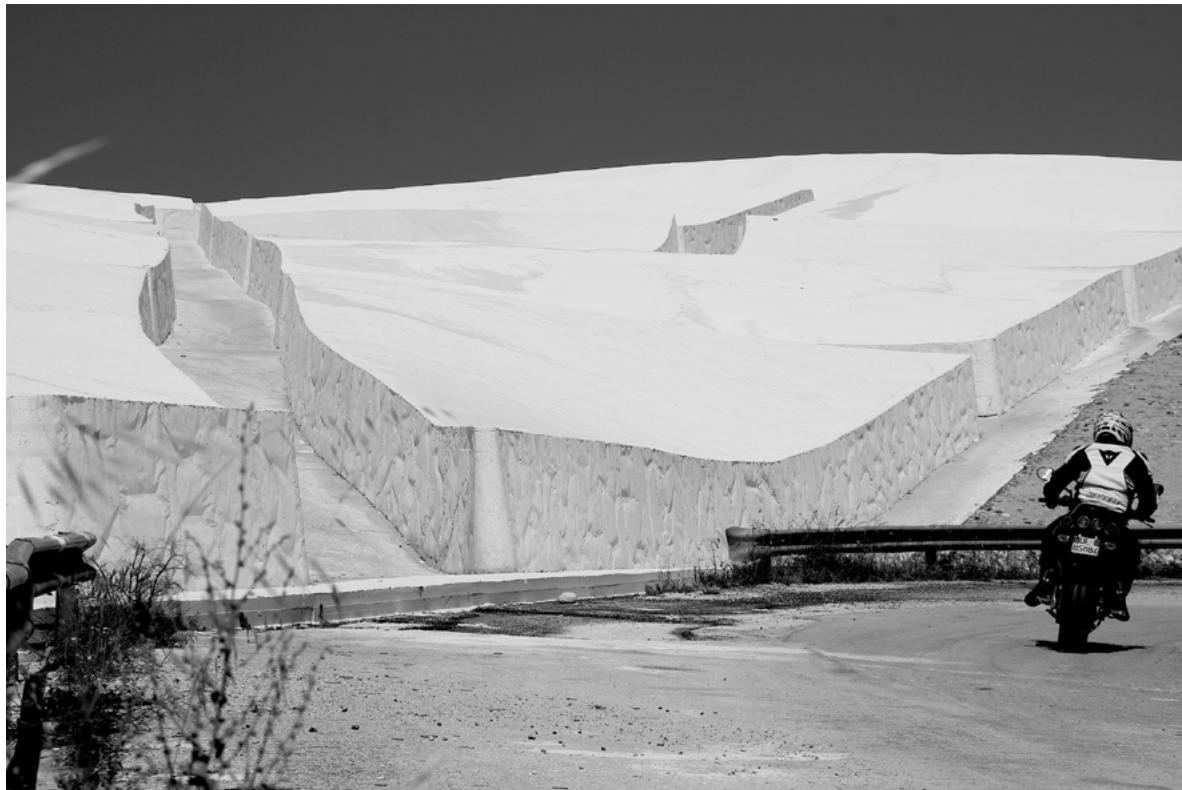
Figura 5. Grande Cretto di Gibellina (Trapani), parte completata nel 2015.