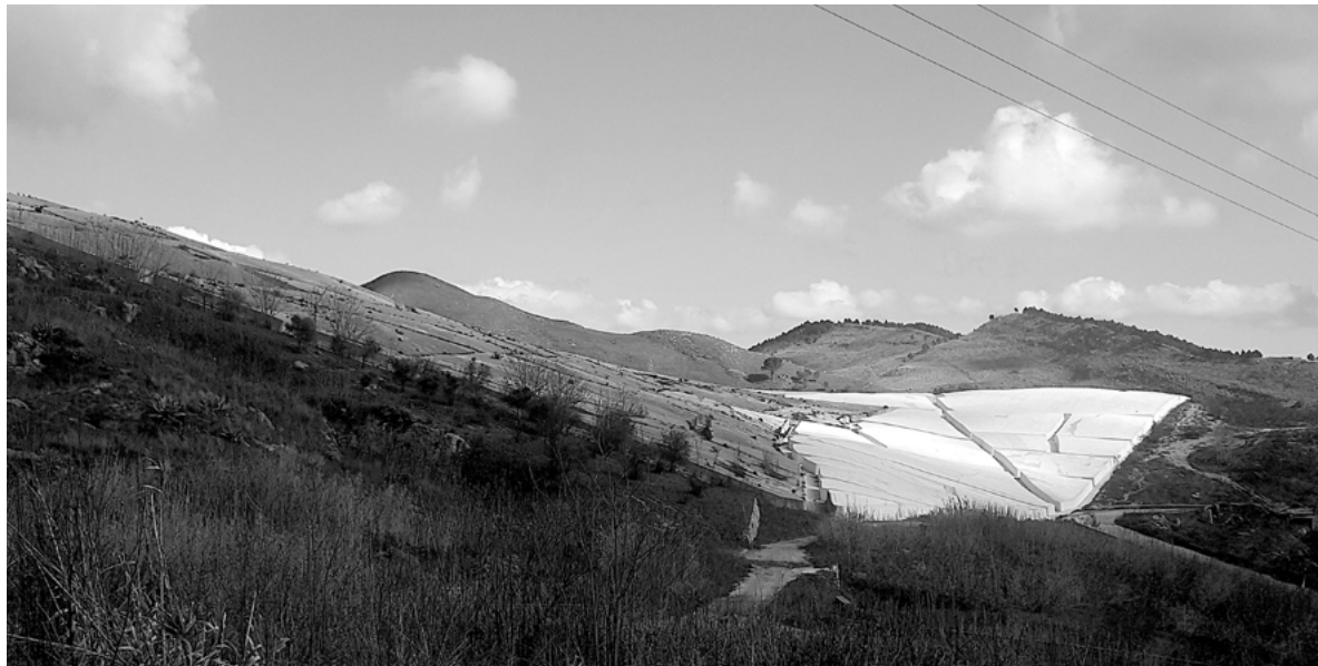
Figura 2. Grande Cretto di Gibellina (Trapani), si nota la parte realizzata tra il 1985-'89 e il 2015.