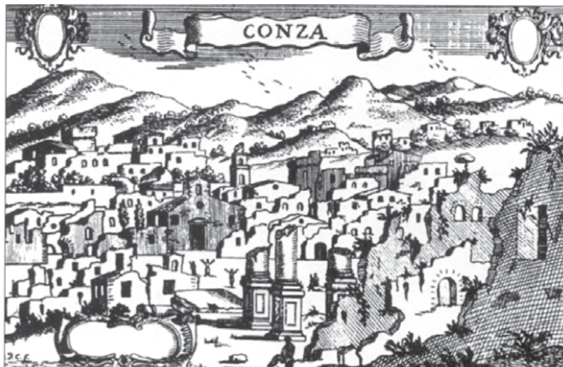
Figura 1. L'abitato di Conza visto dall'abate Pacichelli dopo il sisma del 1694 (da CARLUCCIO 2008, p. 21).