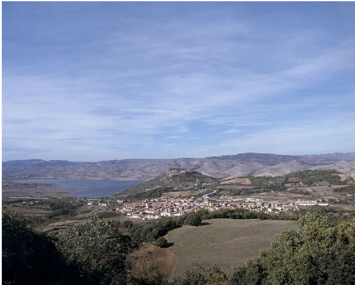
Figura 3. L'antica Compsa e la ricostruzione a valle della nuova Conza della Campania (da CARLUCCIO 2008, p. 79).