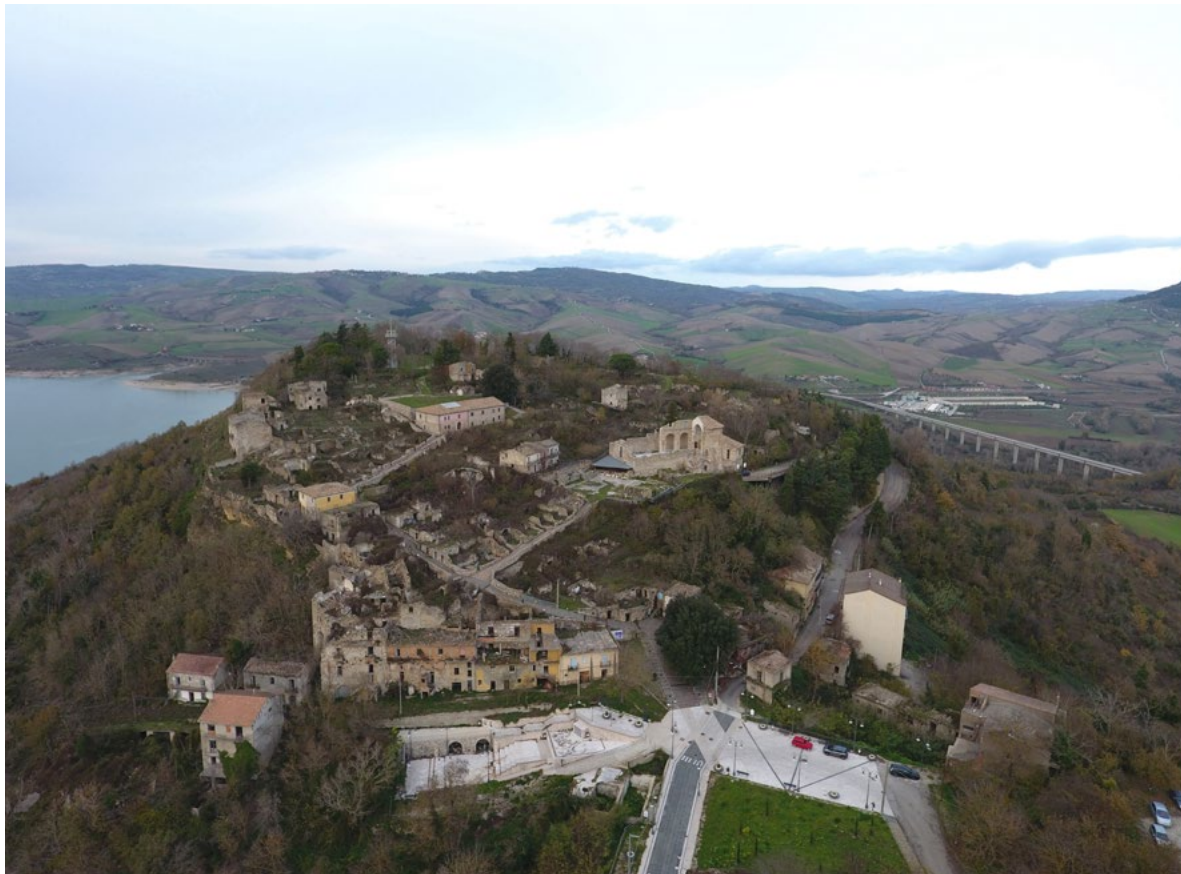
Figura 5. Rapporto tra l'antica Compsa e il paesaggio.