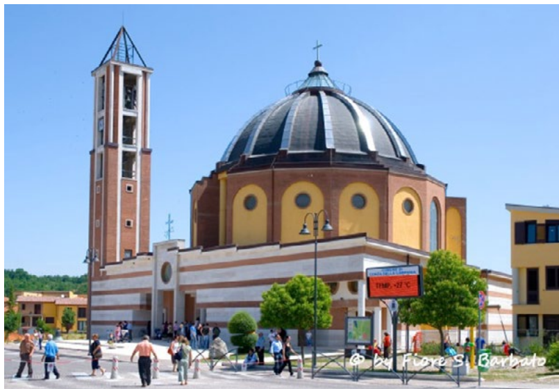
Figura 6. La Cattedrale nuova di Conza della Campania, https://mapio.net/pic/p-11392580/ (ultimo accesso 10 ottobre 2020).