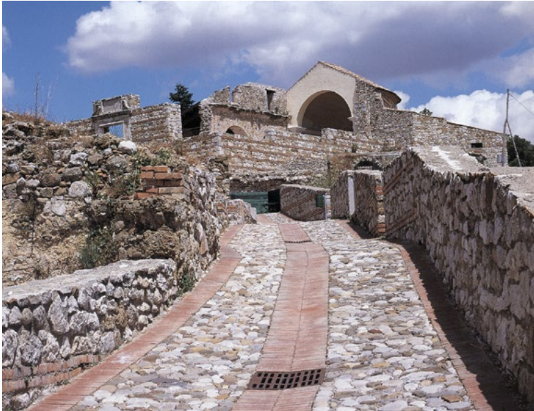
Figura 4. Strada di accesso al Foro e alla Cattedrale di Compsa (da CARLUCCIO 2008, p. 83).

soggetti moderni, che li attribuiamo ad essi» 22 . Questo, d'altronde, è stato uno degli errori commessi durante e dopo la ricostruzione, ovvero la mancanza di un progetto che non solo recuperasse fisicamente i paesi ma che vi desse funzioni adeguate e compatibili per poter continuare a vivere, contemporaneamente, nel sistema territoriale più ampio.