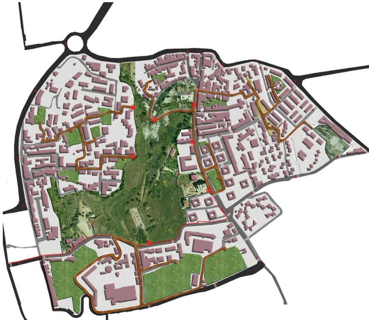
Figura 1. Il nuovo Parco dell'ex Polveriera nel sistema dei quartieri urbani (Laboratorio di Progettazione Urbanistica, elaborazione di M. Bagnato, 2016).