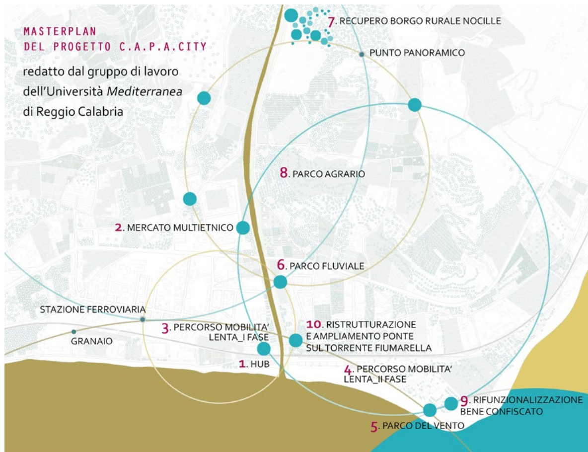
Figura 2. Il progetto pilota del borgo di Pellaro (elaborazione di C. Corazziere, 2017).