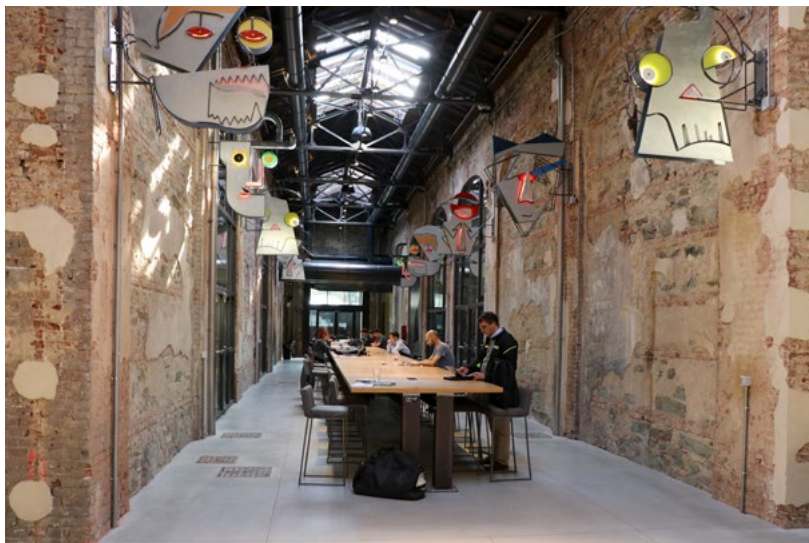
Figura 2. Torino, OGR, area Snodo, il social table , spazio ad uso pubblico per studiare, fare pausa, organizzare incontri di lavoro, socializzare.

in precondizioni per attivare processi la cui logica non sia influenzata da una visione tradizionale legata all'archeologia industriale, «trascenda l'intervento sul singolo edificio/monumento per indirizzarsi verso una nuova definizione delle aree dismesse come patrimonio identitario urbano di valore collettivo capace di rispondere alle esigenze della comunità con soluzioni qualitative e non convenzionali, grazie a un'adattabilità e flessibilità funzionale e spaziale» 6 .