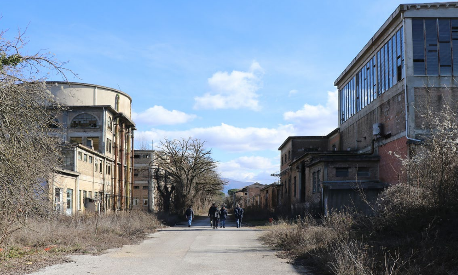
Figura 8. Rieti, ex SNIA Viscosa, sopralluogo con l'associazione NEXT SNIA, impegnata nel promuovere un processo di co-progettazione per la ri-significazione dell'impianto. Nella foto l'asse principale di distribuzione degli impianti e la cisterna circolare per la raccolta delle acque di lavorazione posta sopra i locali dell'ufficio tecnico dove sono stati ritrovati gli elaborati tecnici di progetto consultati presso l'Archivio di Stato (foto C. Corazzieri, 2018).