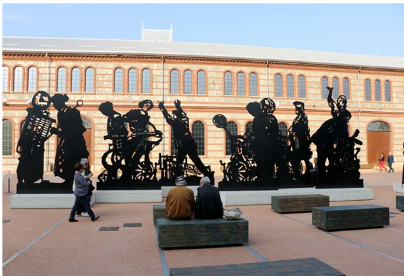
Figura 4. Torino, OGR, la prima installazione site-specific per la Corte Est, Procession of Repairmen di William Kentridge, ispirata alla vocazione ex industriale e operaia del luogo. L'insieme scultoreo in acciaio nero, infatti, è composto da una processione di 15 figure che allude al lavoro di riparazione dei treni e dei corpi.