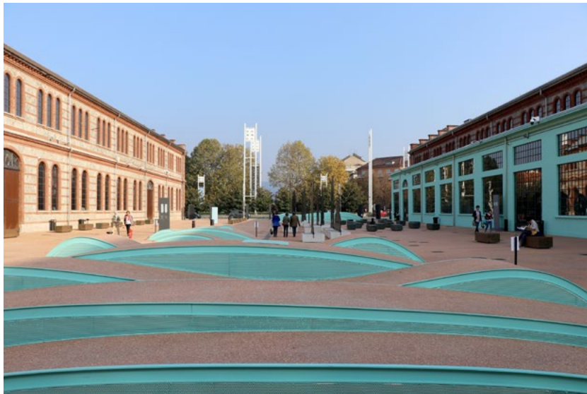
Figura 3. Torino, OGR, la Corte Est, dedicata all'arte a cielo aperto, una delle due piazze pubbliche realizzate dall'intervento di ri-significazione delle Officine ma fruibili autonomamente dalla comunità.