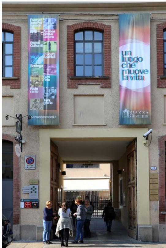
Figura 5. Torino, Piazza dei Mestieri. Ospitato all'interno delle ex Concerie Fiorio, il centro offre attività di formazione e introduzione al mondo del lavoro per ragazzi con problemi familiari e difficoltà economiche, in un quartiere ad alto rischio di dispersione scolastica. Dopo l'intervento di ri-significazione la corte centrale delle ex Concerie Fiorio è divenuta la piazza pubblica su cui si aprono le botteghe artigianali che di giorno impiegano gli studenti e i locali ricreativi che di sera aprono lo spazio alla città.

Non è difficile constatare che dove si sono avviati processi di ri-significazione del patrimonio produttivo concepiti in seno a dinamiche più ampie di innovazione e promozione del contesto prossimo, e non solo, si possono osservare sperimentazioni la cui efficacia è già valutabile in termini di rigenerazione urbana, ambientale e del paesaggio, di ricaduta occupazionale, di innovazione e inclusione sociale, di città educativa e sicura (fig. 5).