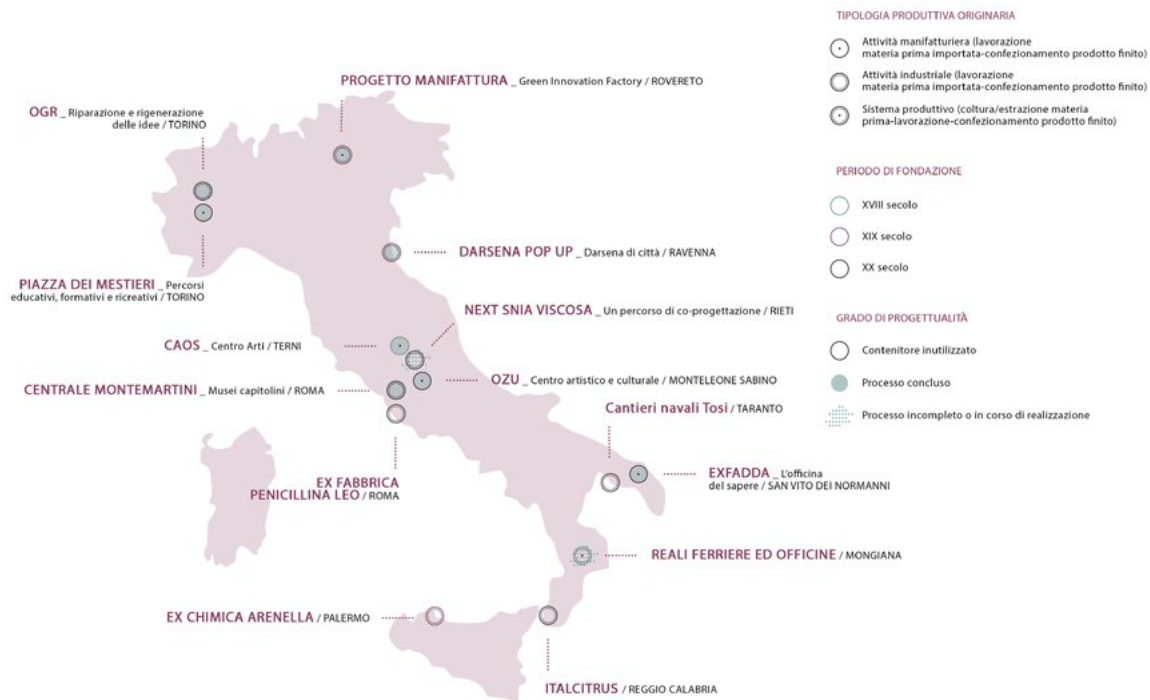
Figura 1. Mappatura dei casi studio in base a tipologia produttiva, periodo di fondazione e grado di progettualità (elaborazione grafica a cura di C. Corazzieri, 2019).