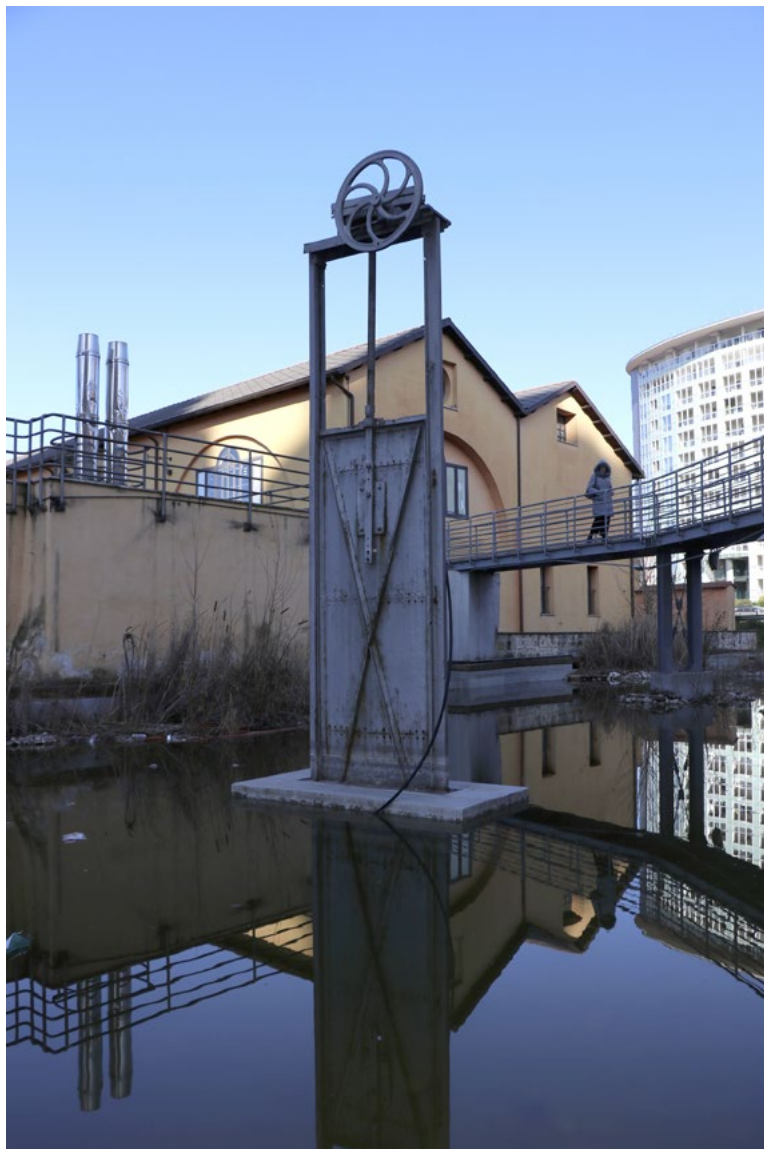
Figura 6. Terni, Centro Arti Opificio Siri (CAOS). La ri-significazione dell'ex ferriera pontificia, oggi centro culturale dedicato alla fruizione delle arti e alla produzione creativa, ha generato anche un complesso spazio di connessione tra il quartiere residenziale nato a ridosso degli storici impianti siderurgici e il centro storico, al di là del fiume Nera.