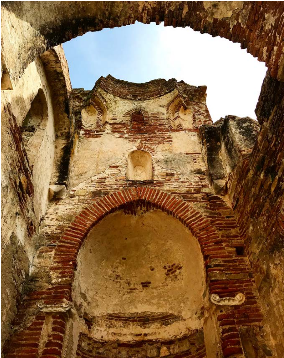
Figura 2. Staiti (RC), chiesa di Santa Maria de' Tridetti (foto D. Ieria), http://www.comune.staiti.rc.it/index.php?action=index&p=73 (ultimo accesso 16 ottobre 2019).