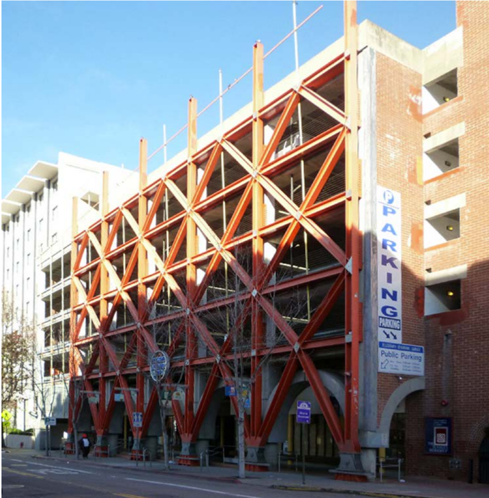
Figura 3. Esoscheletro metallico antisismico intorno al parcheggio in cemento armato di Berkeley California. I controventi a X sul fronte della struttura sono stati aggiunti dopo il completamento dell'edificio per aumentare la resistenza alle azioni orizzontali, https://miraimages.photoshelter.com/image/I0000npJsJdoH3Zw (ultimo accesso 12 febbraio 2019).