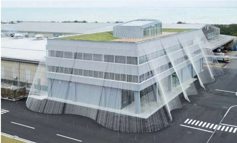
Figura 4. L'edificio della società Komatsu Seiren a Nomi, nella prefettura di Ishikawa, in Giappone, è la prima struttura di adeguamento sismico al mondo realizzata in fibra di carbonio ed è stata progettata dall'architetto giapponese Kengo Kuma, https://o.aolcdn.com/images/dims?quality=85&image_uri=http%3A%2F%2Fo.aolcdn.com%2Fhss%2Fstorage%2Fmidas%2Fba3ea58ffcebf92bc32db0113d45be1%2F203681121%2Fcabkoma-strand-rod.jpg&client=amp-blogside-v2&signature=58fae07d186b20f6743a2fd88abab18d3a824290 (ultimo accesso 12 febbraio 2019).

acciaio resistente al sisma, realizzato in funzione della capacità iniziale dello stabile nello stato di fatto, con l'obiettivo di sostenere le azioni prodotte dal movimento generale dell'insieme architettonico. Tale tecnica può non riguardare l'intero immobile, ma solo parti di esso; dunque la sua incidenza sull'edificio ha una elevata capacità di integrazione con la forma dell'architettura.