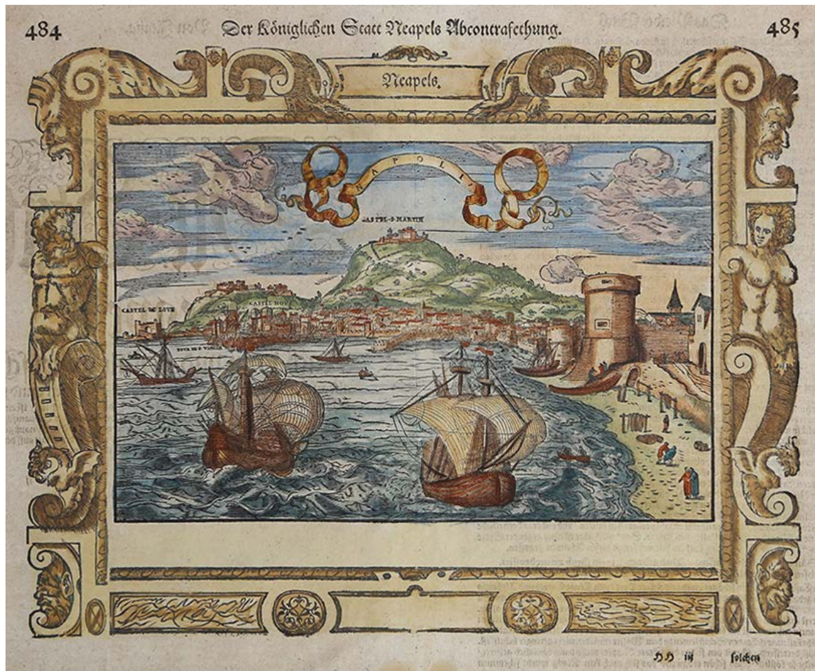
Figura 2. Neapels , 1572 (da MUNSTER 1572, pp. 484-485).