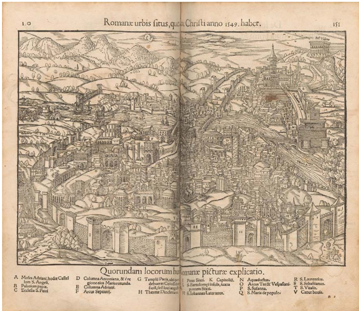
Figura 1. Romanæ Urbis situs quæ ex Christi anno 1549 habet, (da MUNSTER 1552, p. 151).