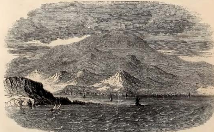
MESSINA, AS SEEN FROM CALABRIA.—FROM A HEIGHT BY THE SON, MAJOR FITZPATRICK.

Messina is situated on the north-west coast, opposite to Calabria, from which it is separated by the Channel of the Faro, here about four miles wide. The town of Messina is built partly on the slope of a steep hill, and partly along the sea-side at the foot of it. The port is bounded by a series of small bays projecting into the sea at the north side of the city and occupying nearly the form of a semicircle. On this narrow strip of land are the citadel, the barracks, the light-house, and the ruins of the towers at the entrance of the harbour, which faces the north. The larger part of the town rises in the form of a square.