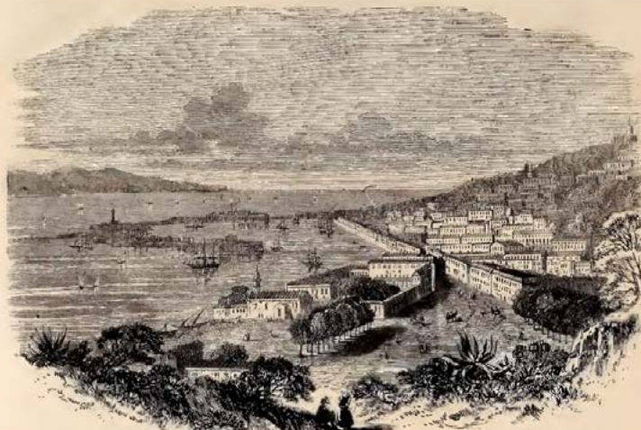
VIEW OF MESSINA.—FROM A DISTANCE BY MR. WINDFORD.