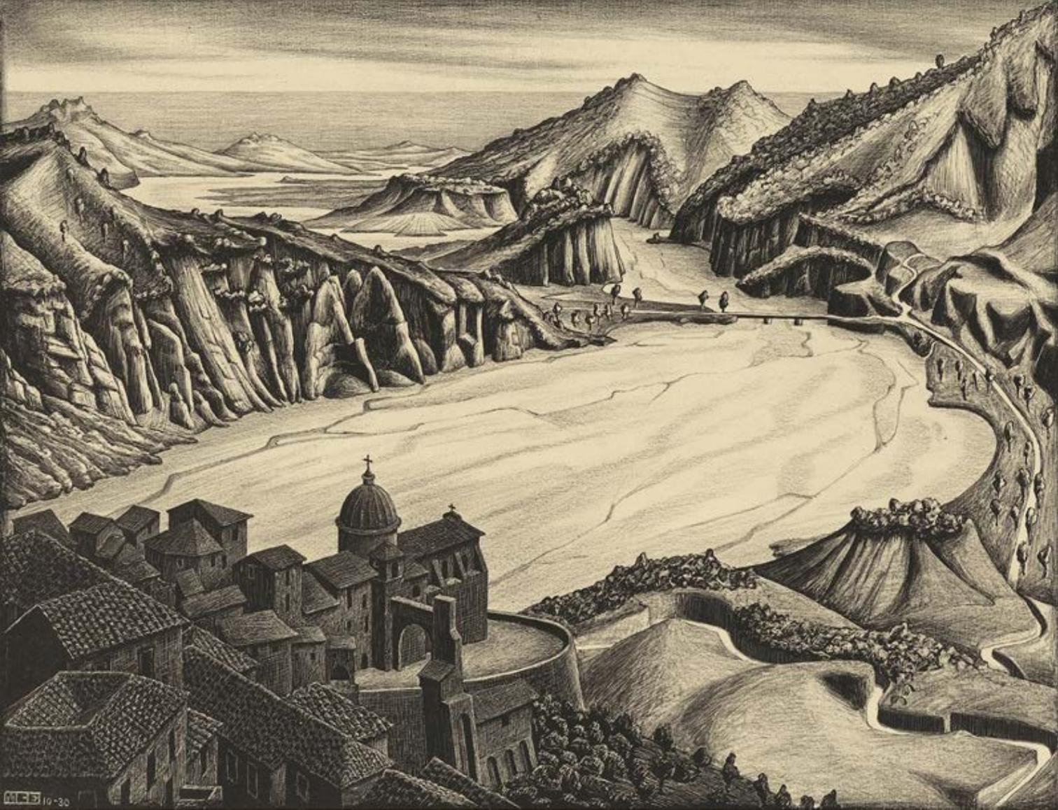
Figura 14. Maurits Cornelis Escher, Fiumara (van Stilo), Calabria , 1930, Litografia (collezione privata).