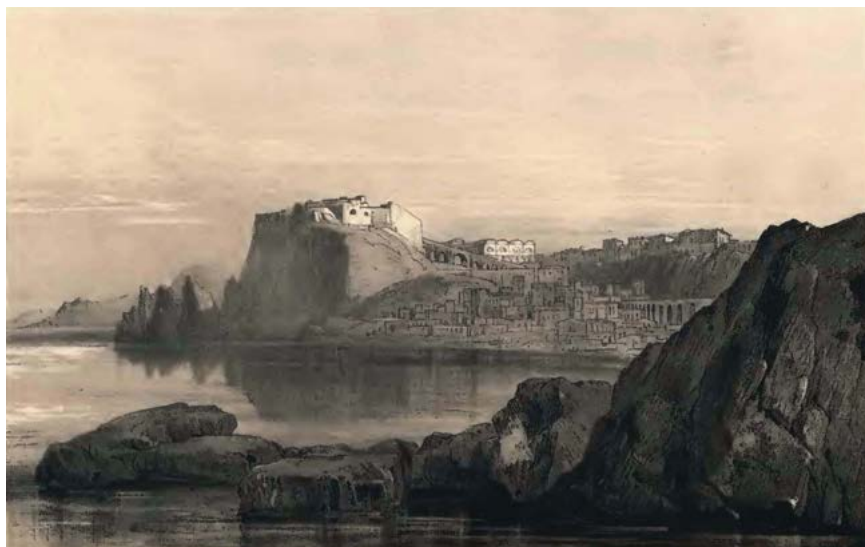
Figura 11. Edward Lear, Scilla , 1852, litografia (da LEAR 1852, tav. 14).