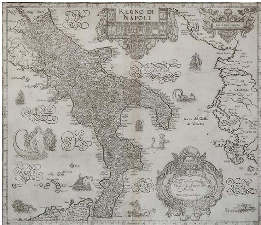
Figura 4. Giovanni Antonio Magini, Regno di Napoli , 1620 (da MAGINI 1620).

come nonostante il contesto condizionante imponesse di focalizzare l'attenzione sulle emergenze fortificate, sono i filtri di una cultura umanistica e i primordiali interessi scientifici dell'erudito Maurand, che avrebbero trovato terreno più fertile nel corso del XVIII secolo, a prendere campo e a riflettersi nell'interpretazione dei luoghi, sia nel racconto scritto, sia nella riproduzione grafica, che lui stesso definisce «al naturale» 25 , in una percezione personale che ne preserva comunque la verosimiglianza.