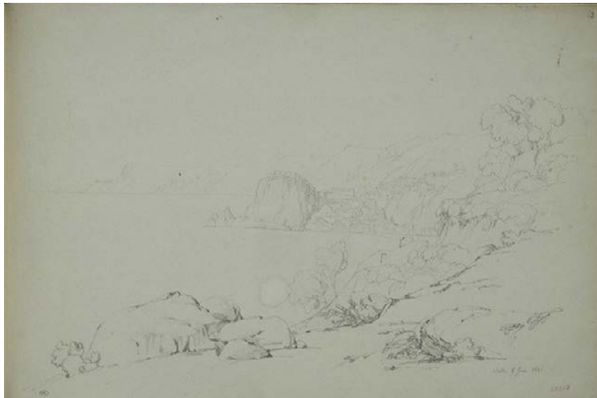
Figura 10. Prosper Barbot, Vue de Scilla , 1826, Musée du Louvre, Département des Arts Graphiques, Fonds des dessins et miniatures, RF 27507r, f. 62, http://arts-graphiques.louvre.fr/detail/oeuvres/3/226229-Vue-de-Scilla (ultimo accesso 3 ottobre 2019).