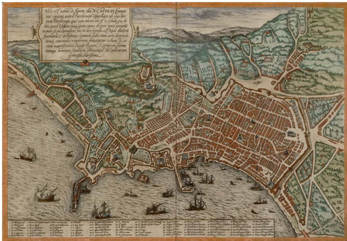
Figura 3. Neapolis (da BRAUN, HOGENBERG 1572, p. 47).