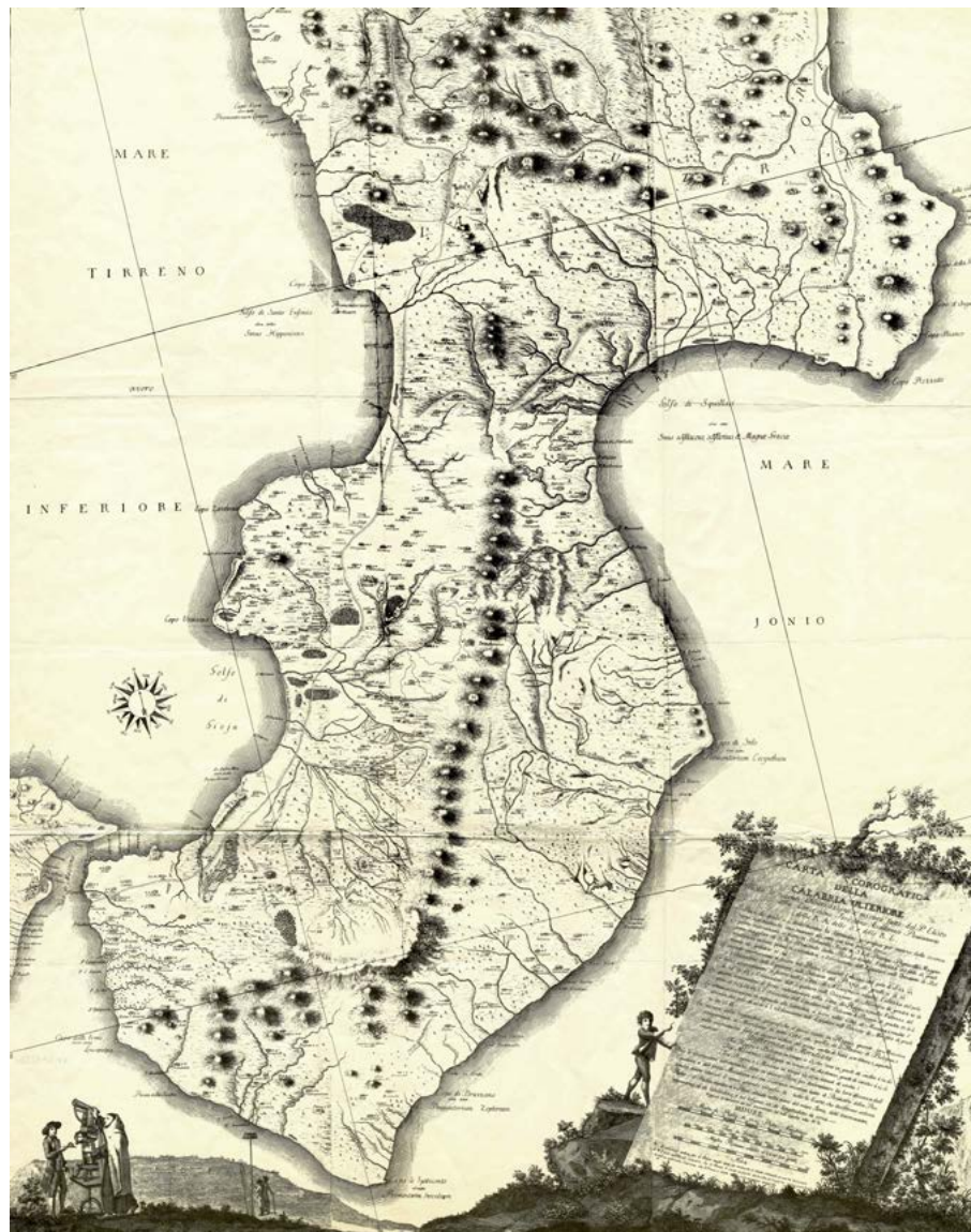
Figura 7. Padre Eliseo della Concezione, Carta corografica della Calabria Ulteriore , 1784 (da SARCONI 1784).