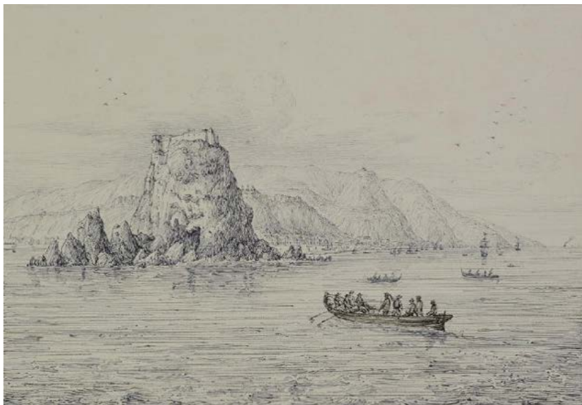
Figura 12. Antonio Senape, Castello di Scilla preso dal mare, prima metà XIX secolo, litografia (collezione privata).

vegetazione rigogliosa e intricata, che sopravanzava le opere dell'uomo e l'uomo stesso, rappresentato come infinitesimale rispetto alla potenza della natura; una rappresentazione, questa, simile all'altra, descritta da Anna Grimaldi, ma riferita allo sgomento rispetto agli effetti del sisma del 1783, nella quale «le figure umane sono inesorabilmente ridotte nelle dimensioni di semplici spettatori» 58 . In alcuni casi i limiti propri dello schizzo non ne riescono a rivelare appieno il pathos, ma è sufficiente la loro comparazione con le incisioni di Edward Lear 59 (figg. 10-11), anch'egli coraggioso avventuriero nell'«esotica» provincia di Reggio Calabria nel 1847, per comprenderne appieno la portata.