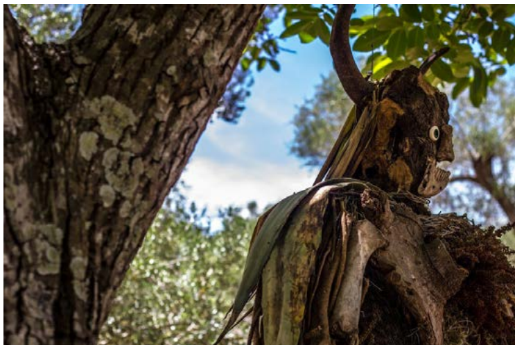
A sinistra, figura 2. Creature dei Paduli: Niodemo “il guardiano dei Paduli” è la creatura-scultura naturale che accoglie i visitatori dell’uliveto pubblico del Parco, è stato realizzato dall’artista Dem nell’ambito del Progetto GAP; sotto, figura 3. Niodemo e i bambini.