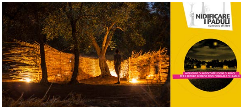
Figura 4. Nidificare i Paduli.

culturali e artistiche rivolte al potenziamento dell’attrattività turistica. L’intervento di recupero della “caseddrrha” è stato l’occasione per sperimentare un modello ecosostenibile di tutela e valorizzazione di una micro-architettura agricola. Attraverso l’applicazione di questo esempio ogni casetta può produrre autonomamente energia elettrica (con pannelli fotovoltaici sul tetto e microeolico), acqua calda (con un pannello termico sul tetto), e dispone di un sistema di fitodepurazione delle acque. Il prototipo realizzato è utilizzato dagli abitanti e dai visitatori, ed è gestito dal Laboratorio “Abitare i Paduli”. Con la sperimentazione di punti di ricettività speciali, completamente sostenibili, come risultato di un concorso di idee e di un workshop internazionale sull’abitare sostenibile, “Nidificare i Paduli”, è stato possibile realizzare sotto gli ulivi un albergo temporaneo, e biodegradabile, all’interno di un parco agricolo in cui ci si sposta a piedi, in bicicletta o a cavallo. Altre iniziative, per lo più gestite con bandi di concorso internazionali, sono rivolte al potenziamento della capacità d’attrazione turistica attraverso iniziative culturali e artistiche, alla divulgazione culturale dei saperi locali e delle produzioni identitarie, tutto con lo scopo di interessare le giovani generazioni.