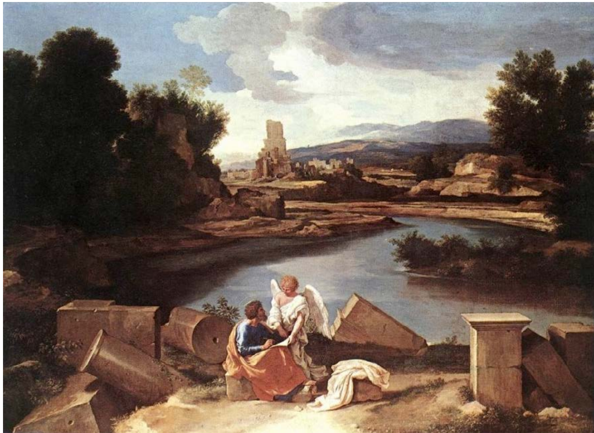
Figura 2. Nicolas Poussin, Paesaggio con San Matteo e l'Angelo , 1645 circa, olio su tela, Berlin, Gemäldegalerie.