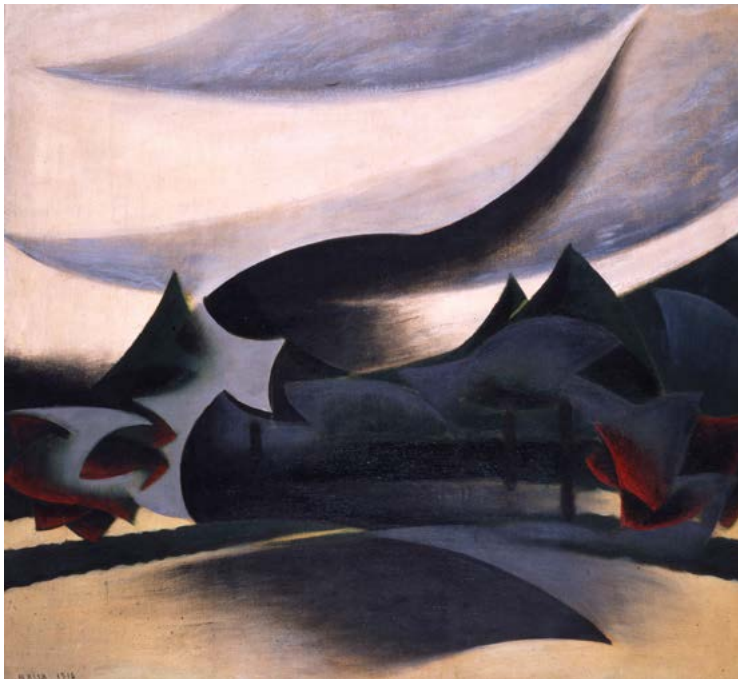
Figura 3. Giacomo Balla, Paesaggio + velo di vedova , 1916, olio su tela, Rovereto, MART.

strutturare lo spazio fisico, Gregotti focalizza l'attenzione sull'insieme dei segni che organizzano il territorio auspicando la necessità di una urgente quanto necessaria rivisitazione della sua immagine per la registrazione delle trasformazioni disposte dalla modernità. Corroborate dalle letture sulla teoria del restauro di Cesare Brandi, dal concetto di metaspazialità del paesaggio di Rosario Assunto, dalle descrizioni romantiche di Lucio Gambi (geografo al quale si deve l'ultima immagine della Calabria prima della "grande trasformazione" del dopoguerra), dalle proiezioni territoriali di Bernardo Secchi e Bruno Gabrielli, dalle trasposizioni metafisiche di Eugenio Turri, gli studi e le ricerche sul paesaggio italiano individuano nella distinzione tra i significati intrinseci dei termini territorio e paesaggio il dato fondativo di una indagine che riporta la grande scala al centro del dibattito internazionale. Riconoscere nel territorio "l'insieme dei segni e dei manufatti realizzati al fine di consentire l'abitare dell'uomo sulla Terra" identifica nella dimensione antropica del territorio l'"hardware" del sistema delineando nel paesaggio il "software", ovvero il programma applicativo connesso "all'insieme dei