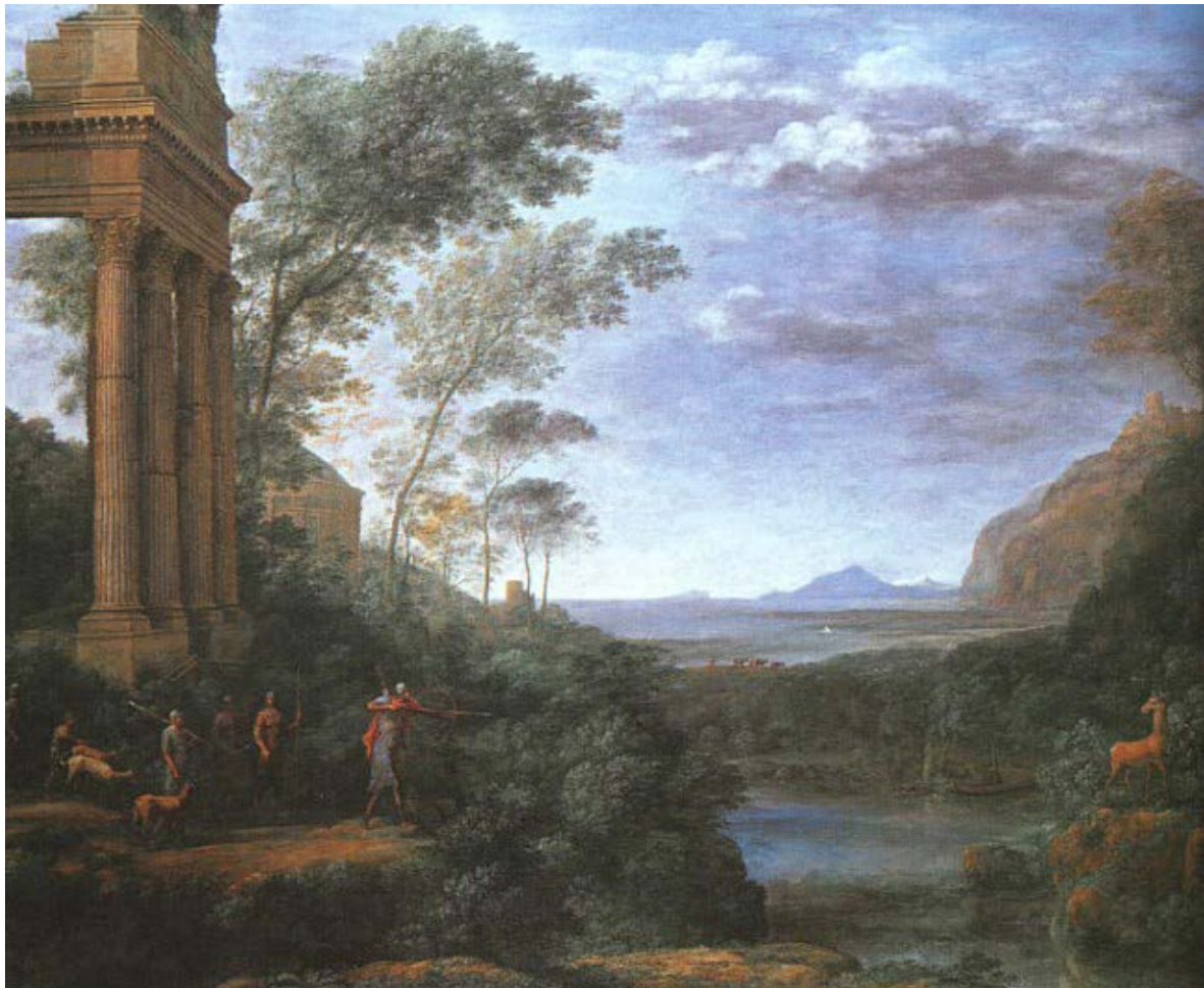
Figura 1. Claude Lorrain, Paesaggio con Ascanio che tira la freccia al cervo di Silvia , 1682, olio su tela, Oxford, Ashmolean Museum.