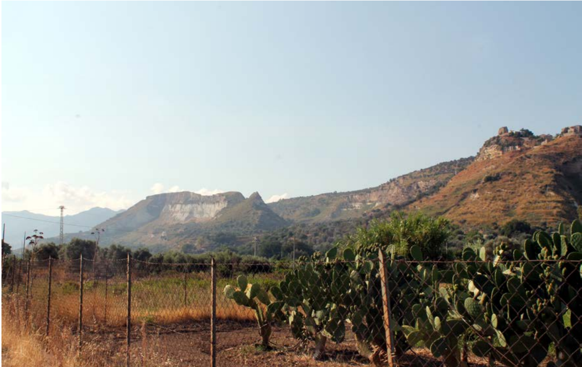
Figura 8. Condoianni