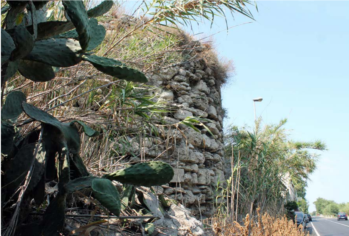
Figura 6. Portigliola, la Torre di Pagliopoli, oggi ricadente nel territorio comunale, vista da Ovest.