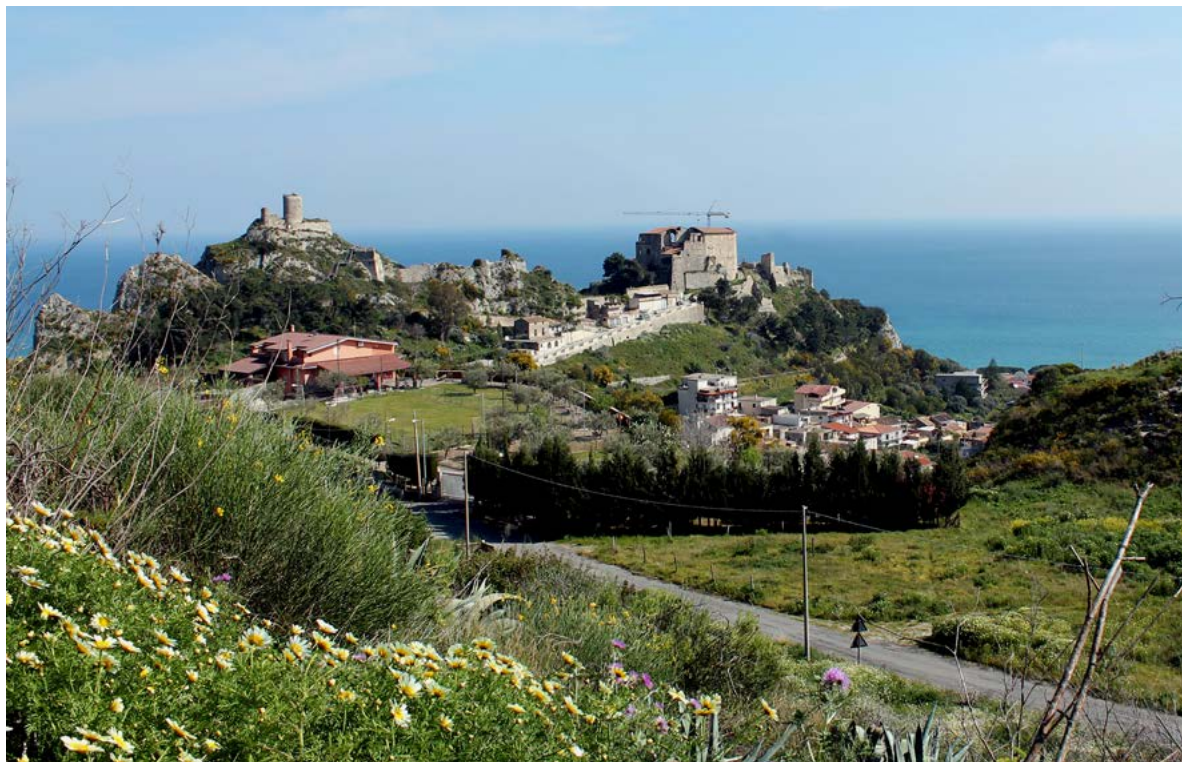
Figura 2. Roccella Jonica, l'abitato antico.