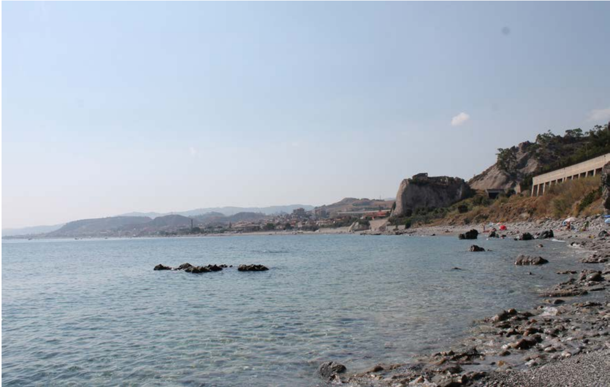
Figura 10. Bova, la marina.