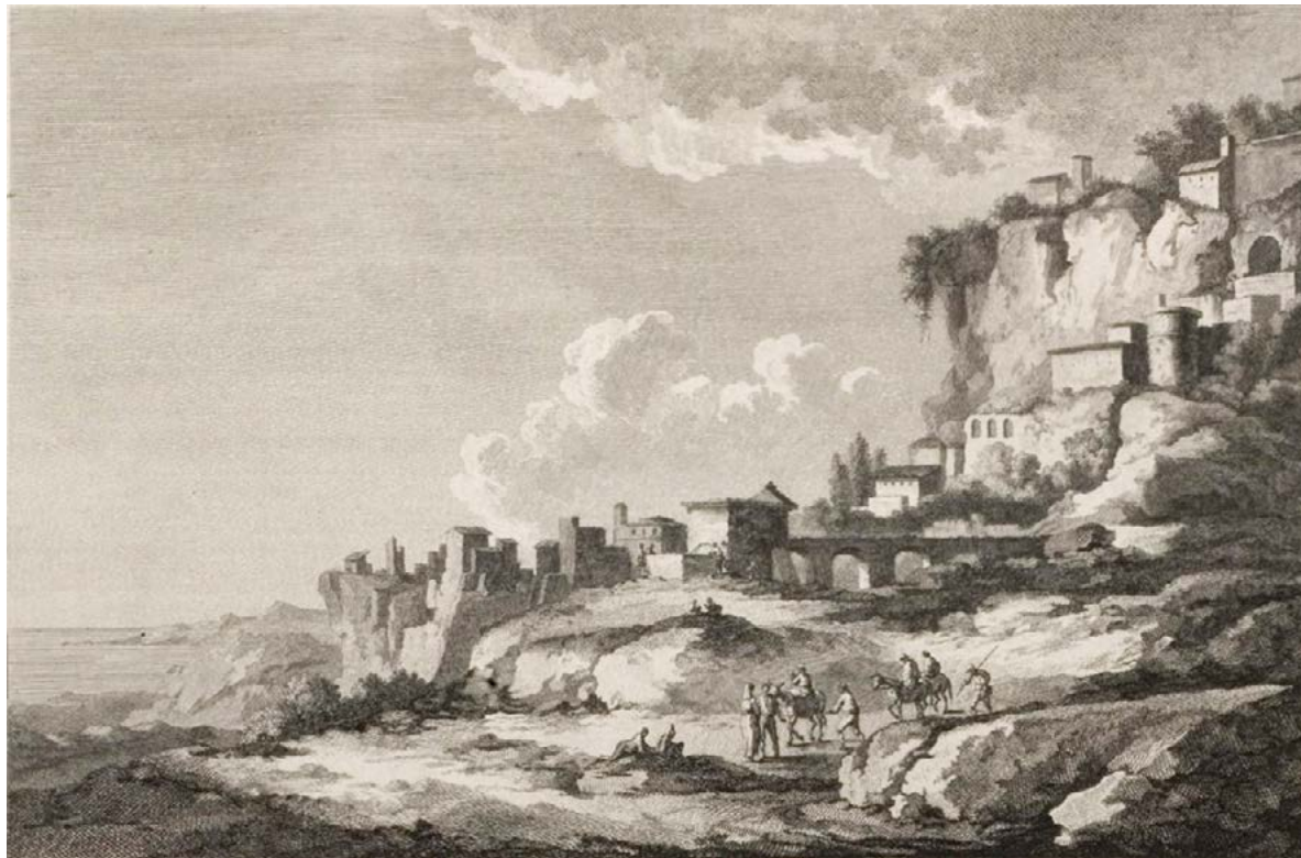
Figura 3. Claude-Louis Châtelet, Vuë de la Ville de Gerace situé dans la Calabre Ultérieure , incisione di Jacques Couché (SAINT-NON 1781-1786, III, 1783, n. 64).