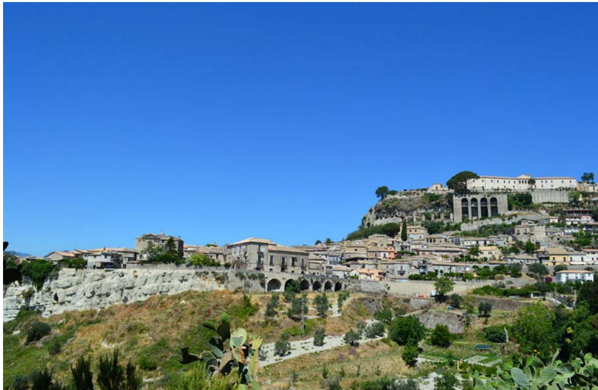
Figura 4. Gerace, vista del versante Est della rocca