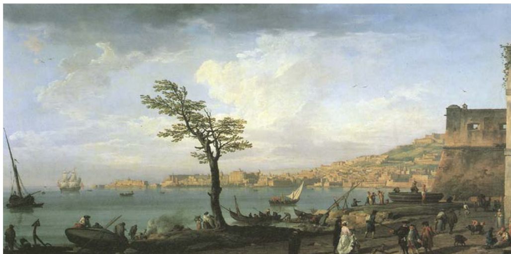
In alto, figura 5. Joseph Vernet, veduta del Golfo di Napoli con il Vesuvio, 1748 c., olio su tela. Paris, Musée du Louvre; in basso, figura 6. Joseph Vernet, veduta del Golfo di Napoli, pendant della figura 5, 1748 c., olio su tela. Paris, Musée du Louvre.