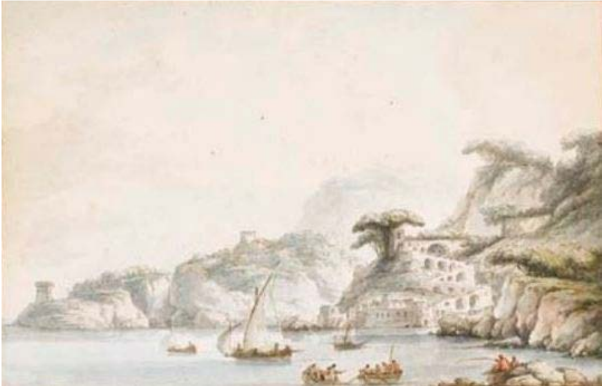
Figura 10. Claude-Louis Châtelet, veduta della costiera di Sorrento presa dai dintorni di Massa Lubrense (firma e iscrizione: «Châtelet del.», «Vue de la Côte de Sorente, à Massa près de Naples», disegno esecutivo per l'incisione, penna e inchiostro marrone, acquerello. Christie's, Paris, vendita 22 giugno 2005, lotto 6 (inedito).