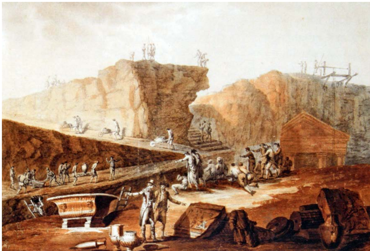
Figura 3. Jacob Philipp Hackert, scavi a Ercolano, acquerello su carta. Düsseldorf, Goethe Museum.