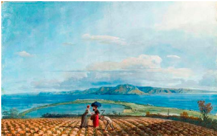
Figura 17. Jean Houël, veduta della costa della Calabria e del Faro presa dal Capo Peloro, disegno esecutivo per l'incisione, guazzo. Paris Musée du Louvre, inv. 27167r.

Tra i libri illustrati stranieri, i “viaggi” d’Italia con il maggior numero d’incisioni furono prodotti dall’incisore ed editore Matthäus Merian di Francoforte. L’Itinerarium Italiae nov-antiquae oder Raiß-Beschreibung durch Italien di Martin Zeiller (1640), con testi meramente compilativi, comprende quarantacinque stampe, in gran parte vedute panoramiche, piante a volo d’uccello, ma anche vere e proprie vedute, di cui ben otto riguardano Napoli e il suo Regno con otto stampe. Ma il viaggio stesso non va oltre Napoli e le notizie sui territori a sud di essa sono tratti da altri libri. Così Zeiller qualifica il Meridione come «cattivo e malsano per il viaggiatore», la Calabria popolata da «gente cattiva che – citando il Mercurius Italicus di Pflaumer del 1625 – non merita di essere vista».