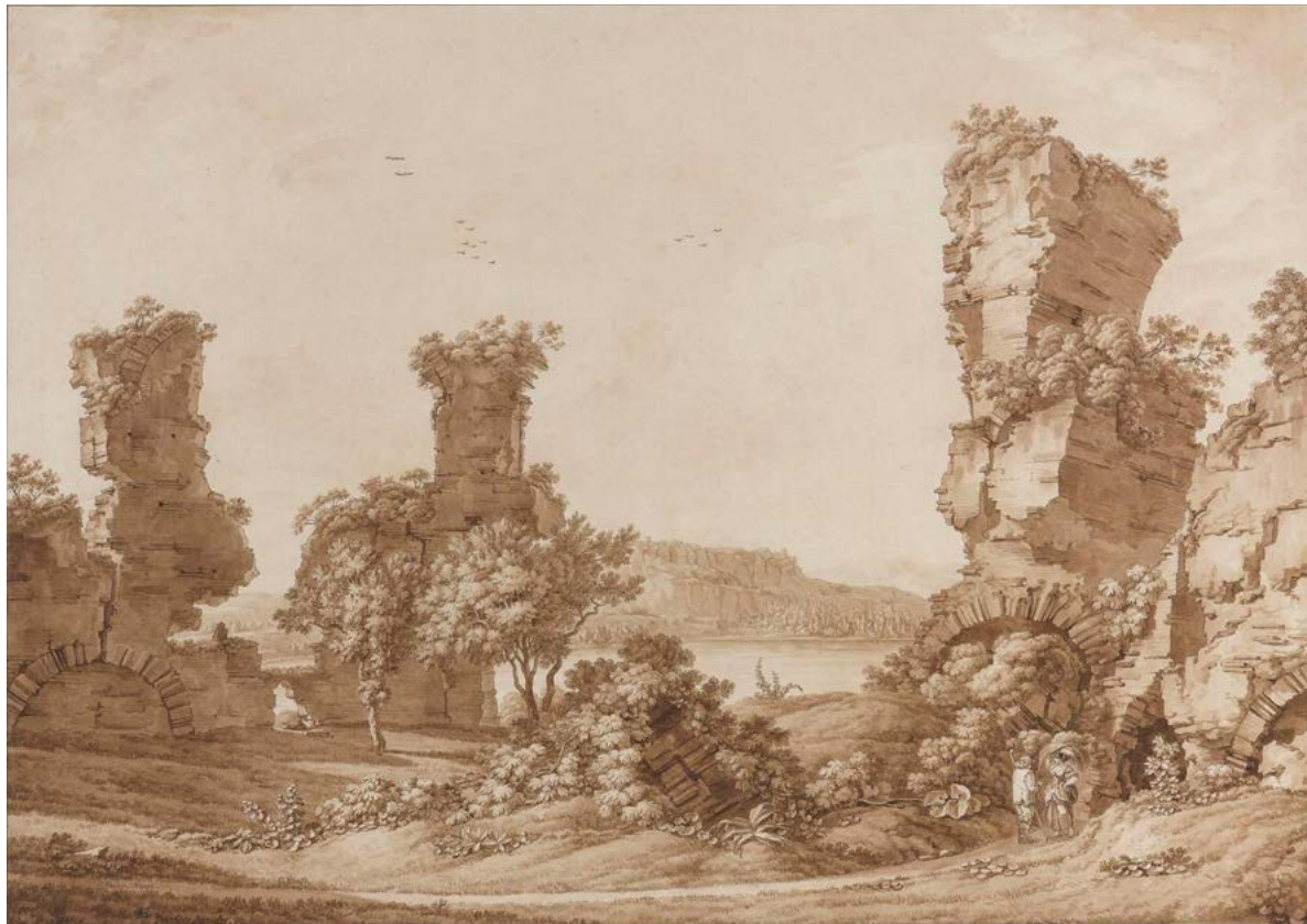
Figura 28. Christopher Heinrich Knip, veduta delle rovine del tempio di Proserpina sul lago di Averno, penna e inchiostro marrone. München, Robbig München.