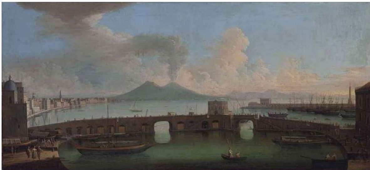
Figura 2. Gabriele Ricciardelli, la baia di Napoli con il ponte nuovo e il Vesuvio sullo sfondo, olio su tela. Già Christie's London, vendita 5 dicembre 2012, lotto 253.

Nella veduta settecentesca prevale una certa ragionevolezza. Essa tende alla verità; anche grazie al largo uso di strumenti ottici, finge, o almeno suggerisce, di dare un'immagine oggettiva (e ciò vale anche riguardo all'apertura del campo visivo), malgrado le manipolazioni evidenti: l'«illusione di verosimiglianza» attribuita da Giuliano Briganti a Gaspar van Wittel.