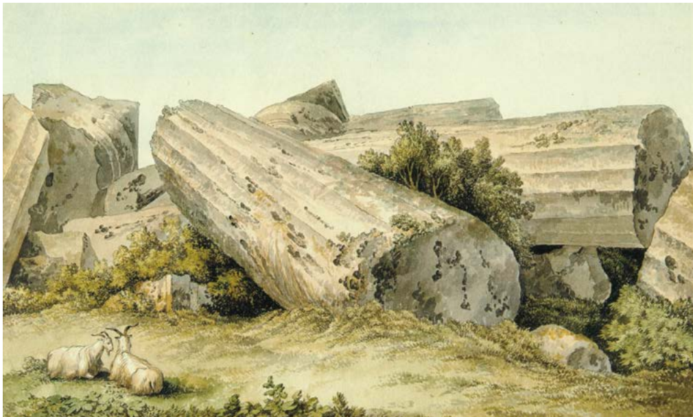
In alto, figura 19. Charles Gore, rovine della città di Selinunte, 1777, matita, acquerello. London British Museum; in basso, figura 20. Jakob Philipp Hackert, Selinunte, Rovine del Grande tempio di Selinunte, penna e acquerello su carta. London British Museum.