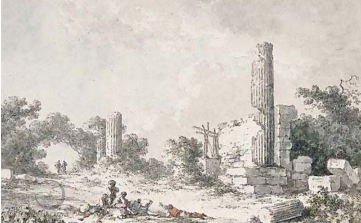
Figura 12. Claude-Louis Châtelet, veduta delle rovine del Tempio di Castore e Polluce ad Agrigento, disegno esecutivo per l'incisione (con cambiamenti nella disposizione delle figure), matita, penna e inchiostro marrone, acquerello. Christies, London, vendita 10 luglio 2001, lotto 131 (inedito).