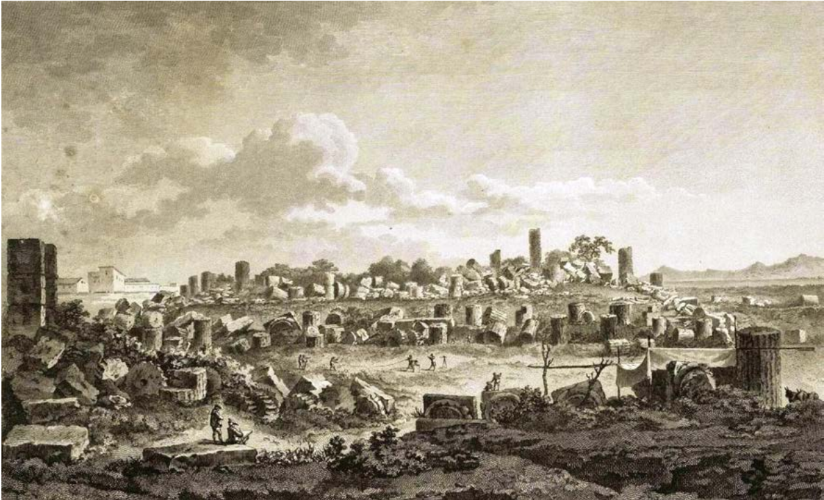
Figura 21. Louis-Jean Desprez, Vuë générale des Ruines et des débris du Temple de Selinunte en Sicile , incisione di Jean D'Ambun (J.C. Richard de Saint-Non, Voyage pittoresque ou description des royaumes de Naples et de Sicile , vol IV.1, 1785, n. 76).