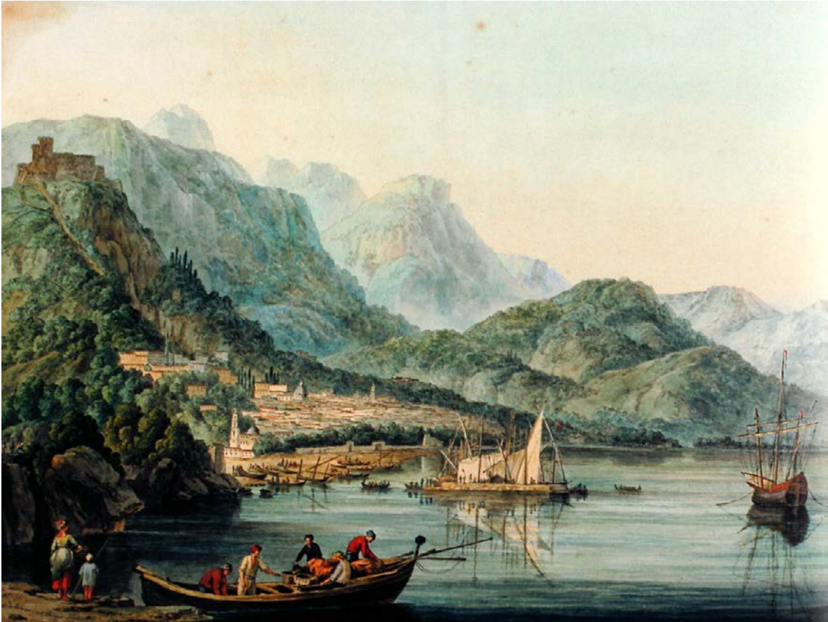
Figura 32. Jakob Philipp Hackert, veduta del Golfo di Salerno, acquerello su carta. Lübeck, Museum für Kunst und Kulturgeschichte, inv. 2000/111 – SH.