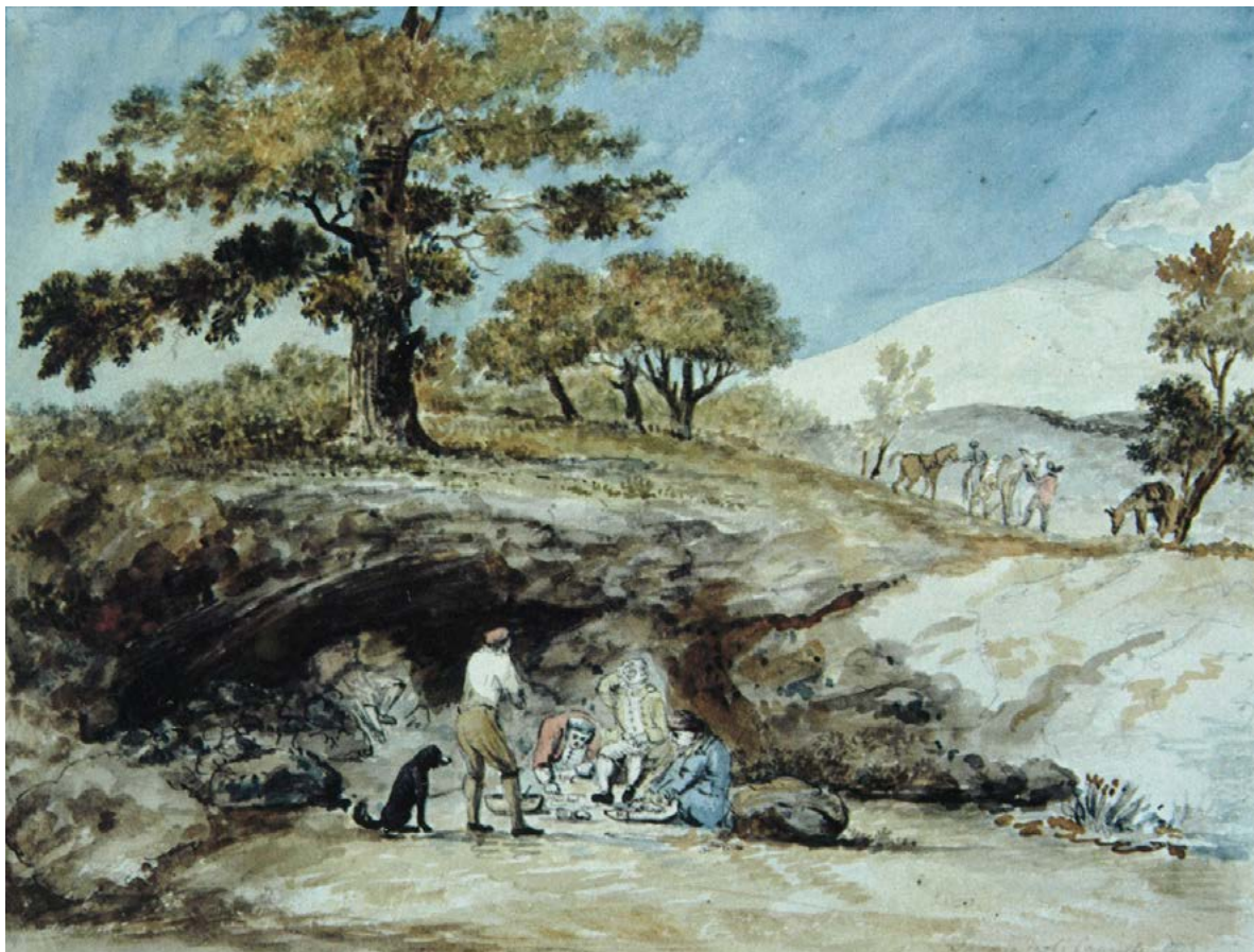
Figura 24. Charles Gore, Il riposo dei viaggiatori presso la Grotta del Capro sull'Etna. Weimar, Goethe-Nationalmuseum.