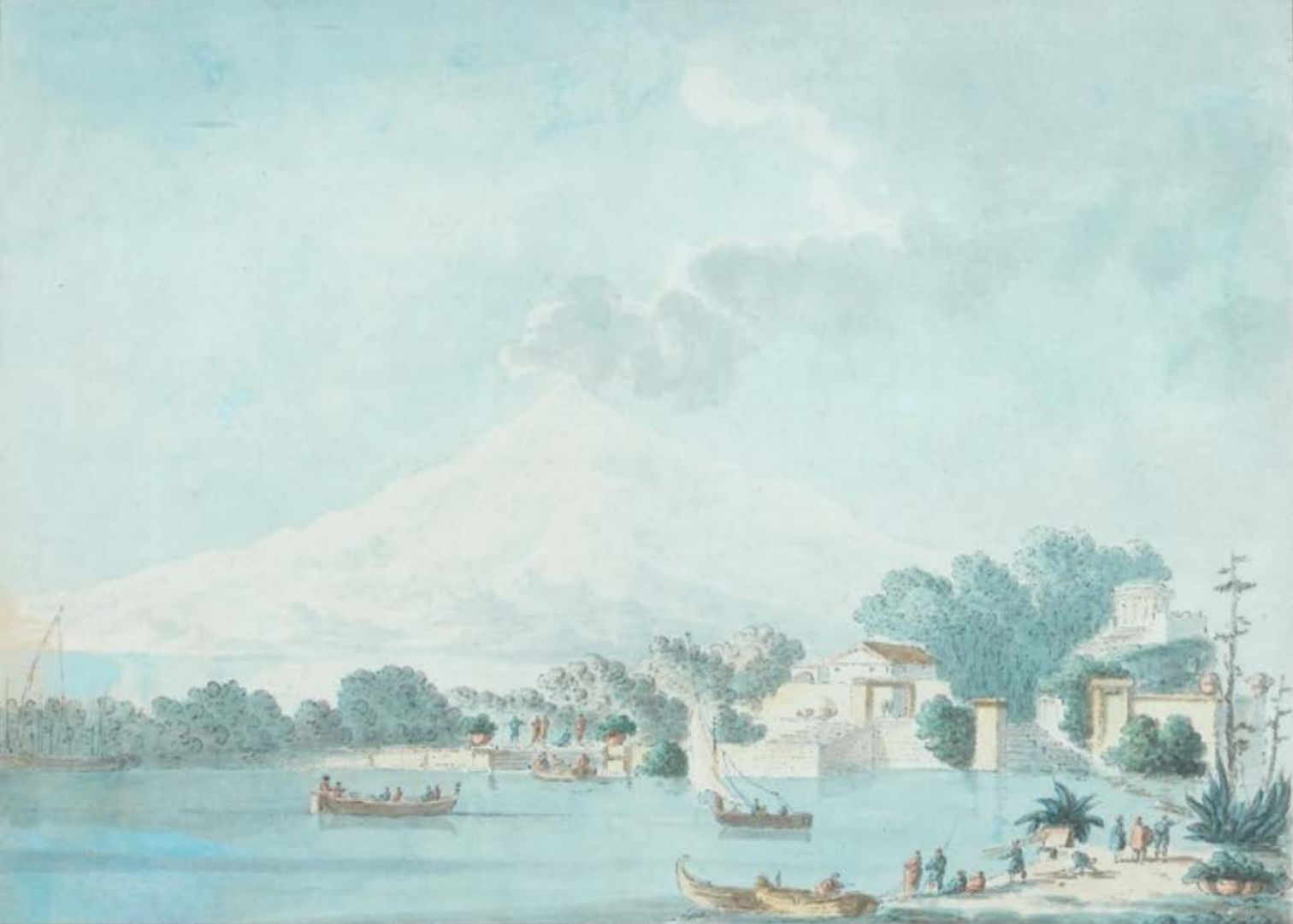
Figura 11. Claude-Louis Châtelet, veduta dell'Etna presa dal giardino del principe Biscari, replica del disegno esecutivo per l'incisione, penna e inchiostro nero, acquerello. Thierry de Maigret, Paris, vendita 9 aprile 2008, lotto 57 (inedito).