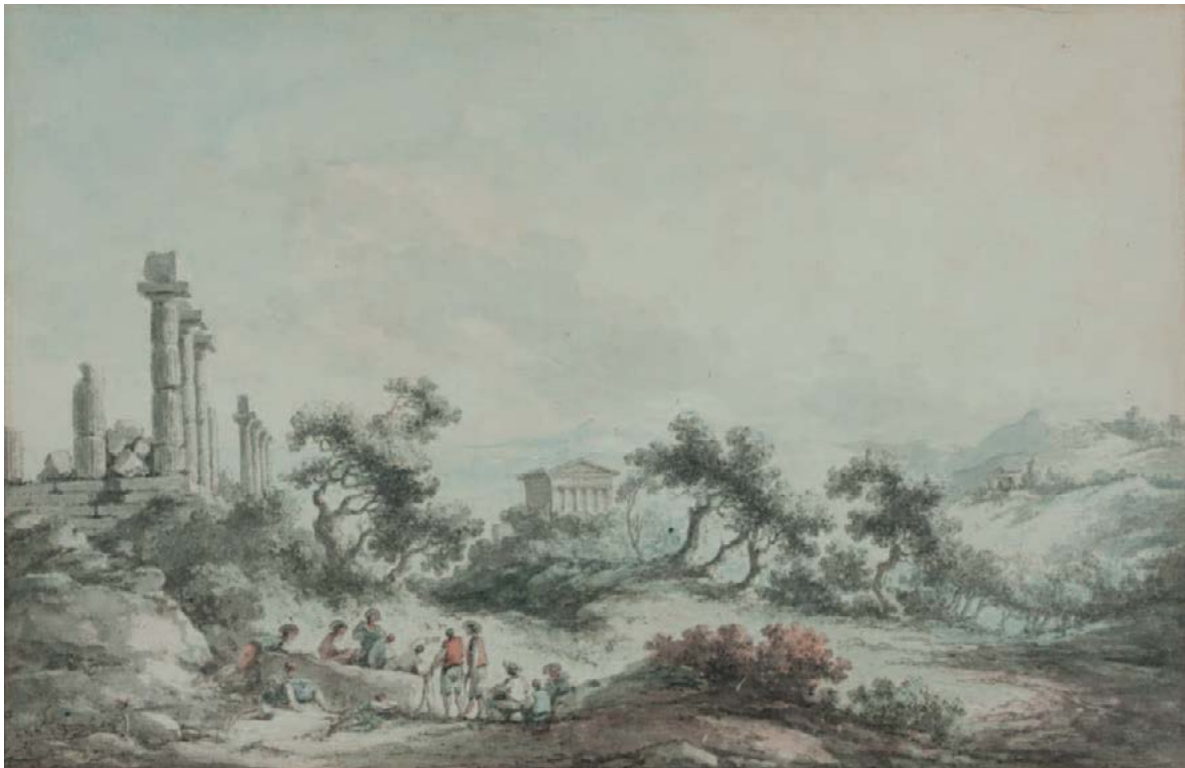
Figura 13, Claude-Louis Châtelet, terza veduta delle rovine dei templi di Agrigento presa dal tempio di Giunone, disegno esecutivo per l'incisione (con cambiamenti nella disposizione delle figure), penna e inchiostro nero, acquerello. Aguttes, Neuilly sur Seine, vendita 16 maggio 2017, lotto 6.