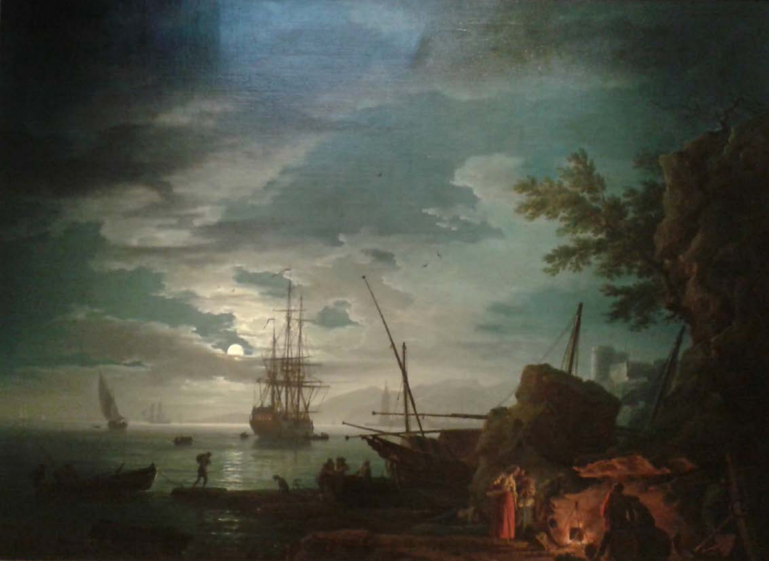
Figura 4. Claude-Joseph Vernet, Paesaggio, olio su tela (Bologna-Paris, Collezione privata, M. Nobile).