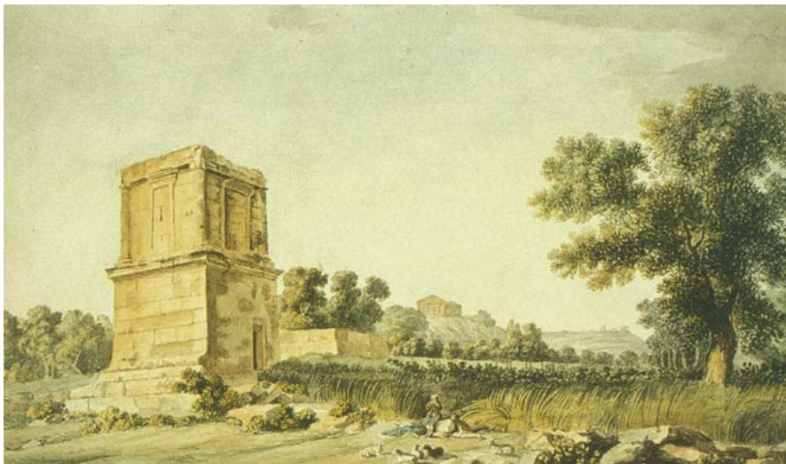
In alto, figura 22. Charles Gore, Monte Etna, 1777, matita, acquerello. London, British Museum; a sinistra, figura 23. Charles Gore, Tomba di Theron ad Agrigento, 1777, matita, acquerello. London, British Museum.