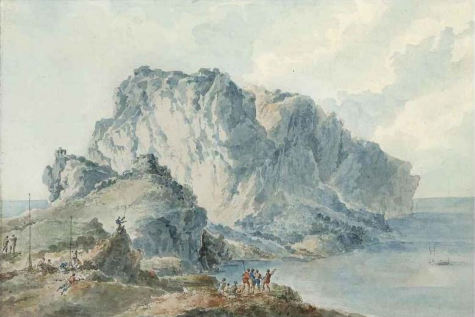
Figura 9. Claude-Louis Châtelet, seconda veduta dell'isola di Capri, variante compositiva del disegno esecutivo dell'incisione, penna e inchiostro nero, acquerello. Christie's, Paris, vendita 26 marzo 2014, lotto 97 (inedito).