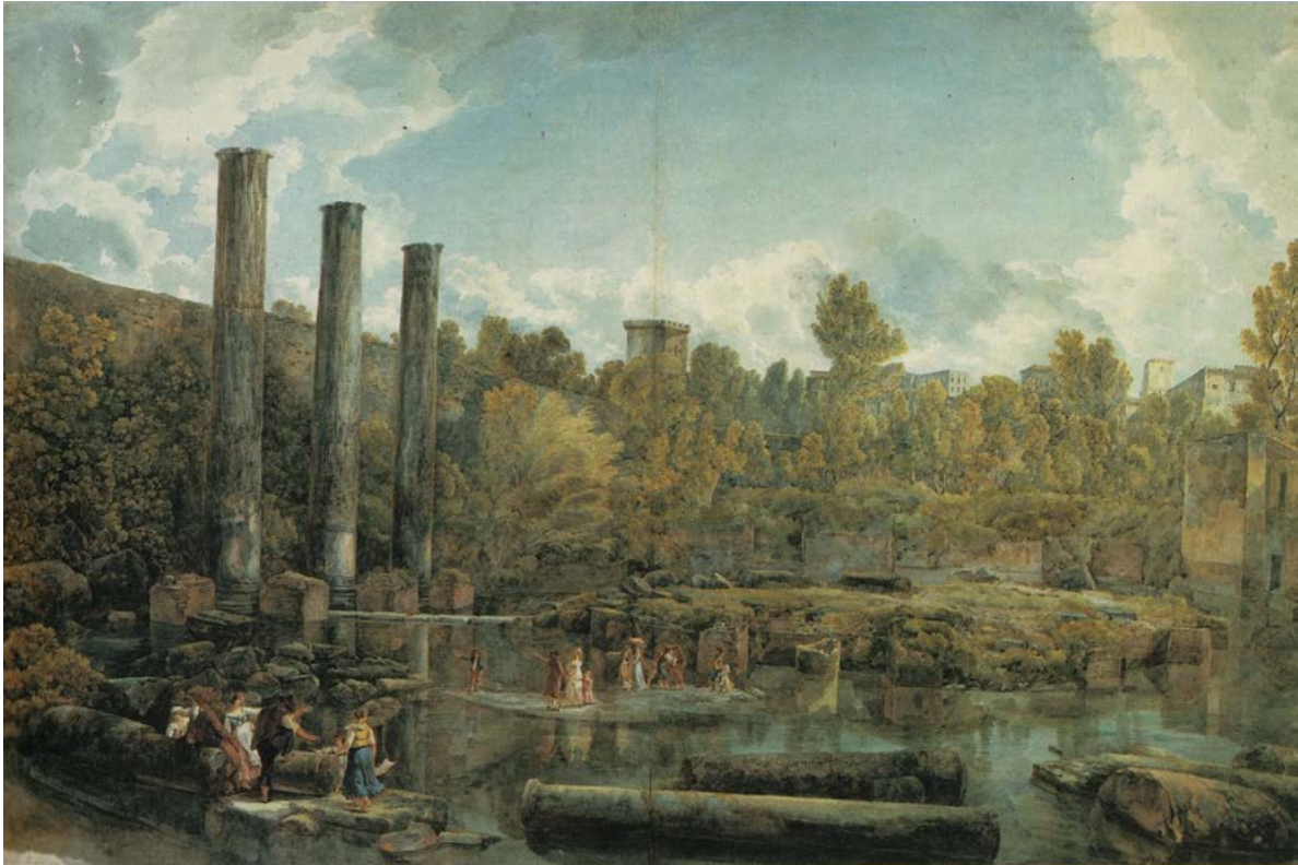
Figura 4. Louis Ducros, tempio di Giove Serapide a Pozzuoli, penna e inchiostro nero, acquerello. Lausanne, Musée Cantonal des Beaux Arts.