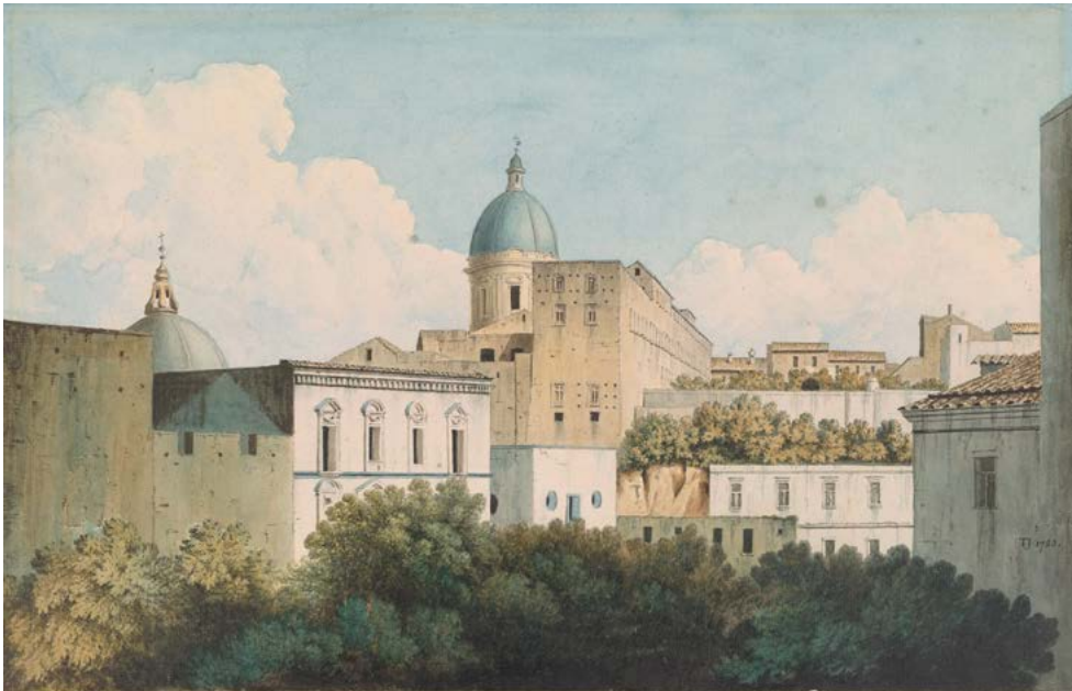
In alto, figura 29. Thomas Jones, Tetti di Napoli, olio su carta. Oxford, Ashmolean Museum; in basso, figura 30. Thomas Jones, la cupola della chiesa di Santa Maria degli Angeli a Pizzofalcone, 1783, matita, acquerello su carta. New York, The Morgan Library and Museum.