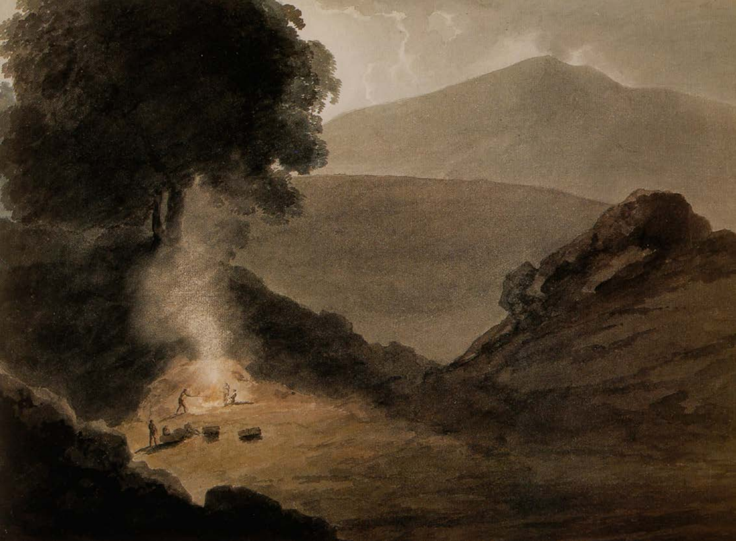
Figura 27. Joseph Robert Cozens, veduta dell'Etna dalla Grotta del Capro, acquerello su carta. London, British Museum.