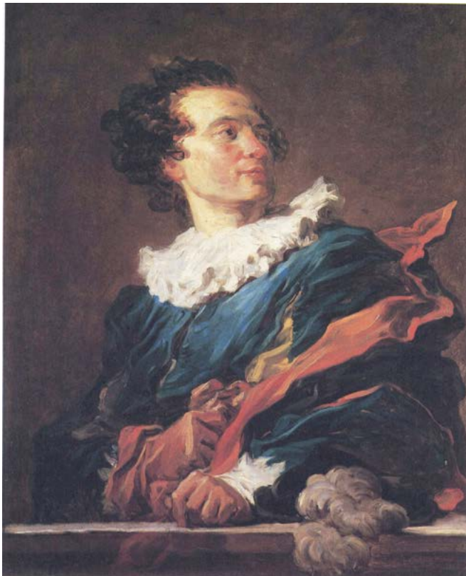
Figura 6. Jean-Honoré Fragonard, Ritratto dell'abate di Saint-Non, Paris, Musée du Louvre. Sul retro un'antica etichetta stabilisce l'identità del modello e ci informa che il quadro è stato dipinto "in un'ora" nel 1769 (da ROSENBERG 1986).