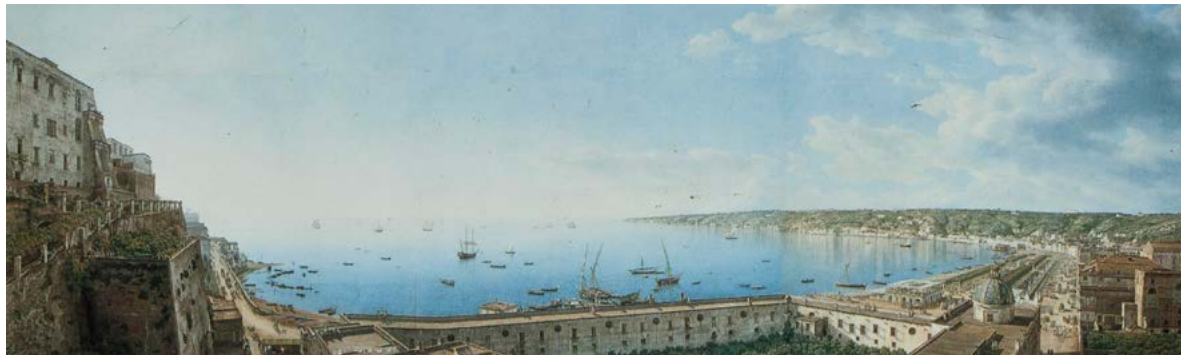
Figura 1. Giovanni Battista Lusieri, veduta di Napoli dal casino Hamilton a Pizzofalcone verso Posillipo, 1791, penna e inchiostro nero, acquerello. Los Angeles, The J. Paul Getty Museum.

edificio reale da una parte (Jan van Goyen, Jacob van Ruisdael), il prospetto di un unico edificio (Giovanni Battista Falda) dall'altra; un frammento di realtà insignificante, scelto per vezzo capriccioso, come un cortiletto o uno angolo d'edificio (Hubert Robert) da una parte, un paese incluso in un panorama con fiumi e colline dall'altra.