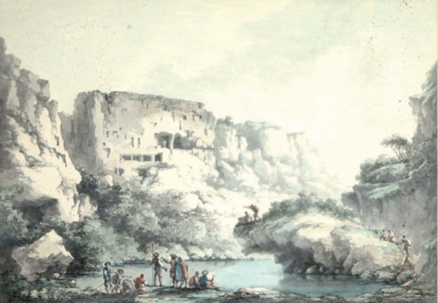
Figura 14. Claude-Louis Châtelet, veduta di una parte delle grotte nella Val d'Ispica (cava d'Ispica) nella Val di Noto, disegno esecutivo per l'incisione, matita, penna e inchiostro grigio, acquerello, Kâ-Mondo, Paris, vendita 17 giugno 2009, lotto 6 (inedito).