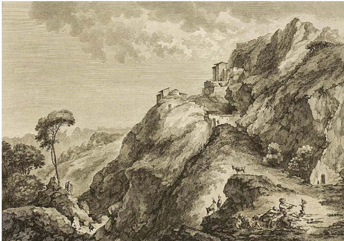
Figura 15. Chevalier de Bosredon Vatange, Vuë du château de Sperlinga en Sicile , incisione di G. Paris (SAINT-NON, Voyage pittoresque ou description des royaumes de Naples et de Sicile , IV.1, 1785, n. 45).