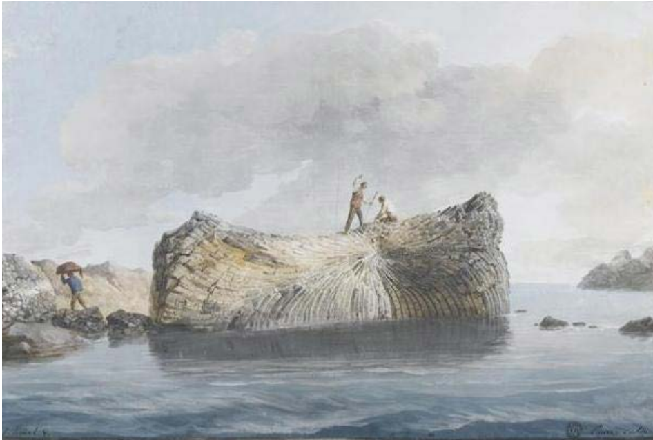
Figura 18. Jean Houël, scoglio di basalto del porto della Trezza, disegno esecutivo per l'incisione, guazzo, Paris Musée du Louvre, inv. 27188r.

suggestivi e attraenti come la Solfatarata di Pozzuoli, il Vesuvio e lo Stretto di Messina (denominato di “Scylla e Charybdis”) eseguite nel 1631 da Joachim von Sandrart. Tuttavia queste pubblicazioni non sono libri di viaggio ma repertori manualistici con le località disposte in ordine alfabetico, come lo erano la Cosmographia di Sebastian Münster (prima edizione del 1544), e il celeberrimo Civitates Orbis Terrarum di Braun e Hogenberg (prima edizione del 1572), che documenta ben 546 località. Ed è significativo che tra le immagini, non limitate all'Italia, di queste opere se ne trovino di Messina e Palermo.