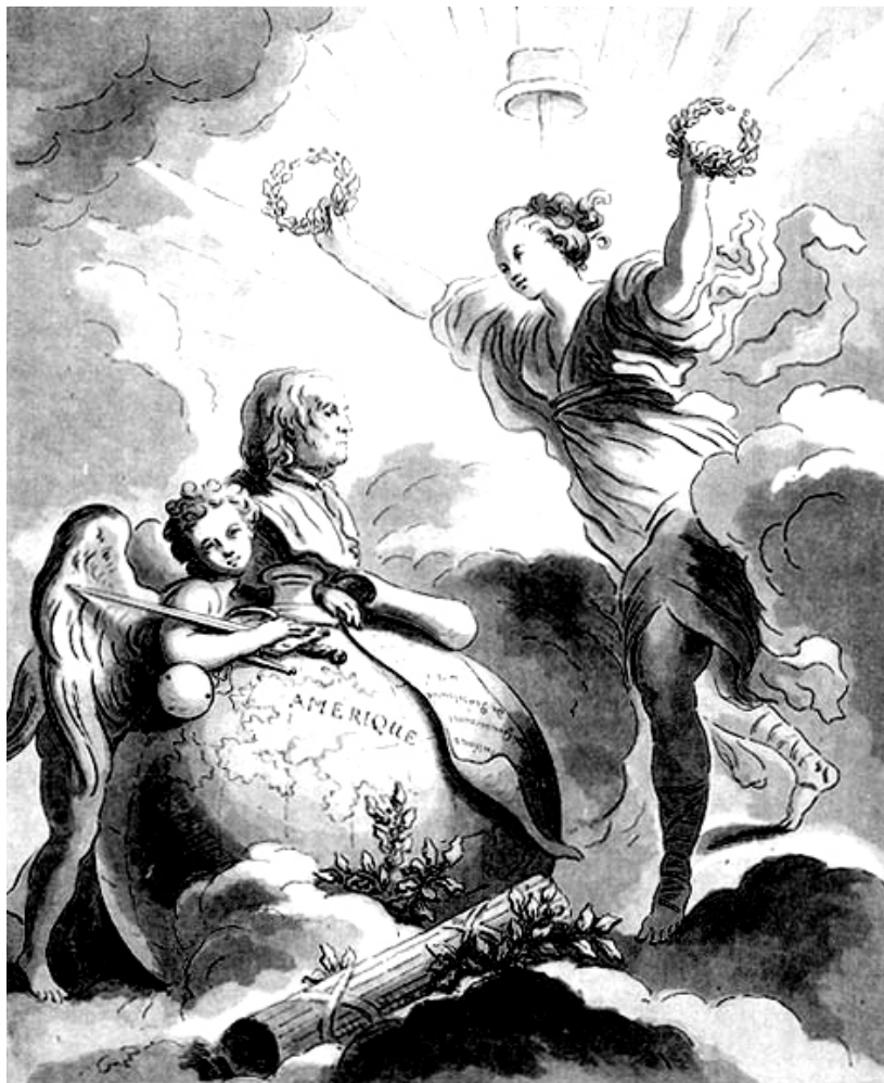
Figura 1. Jean-Claude Richard de Saint-Non e/o Jean-Honoré Fragonard, Le docteur Francklin couronné par la Liberté , acquatinta.