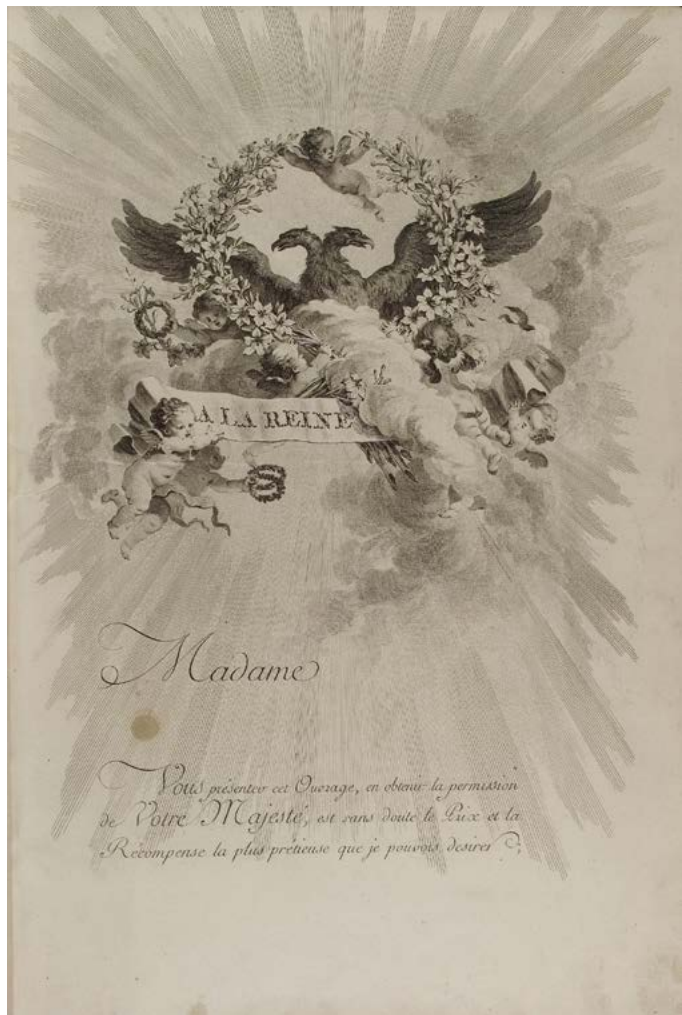
Figura 2. Jean-Honorè Fragonard, Figura dedicatoria alla Regina Maria Antonietta (SAINT-NON 1781-1786, I, 1781).