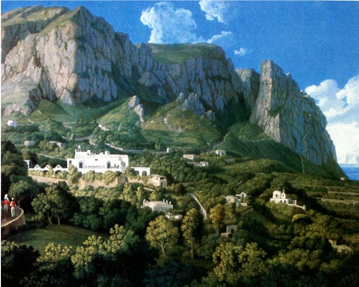
Figura 31. Jakob Philipp Hackert, veduta del Monte Solaro a Capri con il villaggio di Anacapri e il palazzo Canale, Caserta, Palazzo Reale.