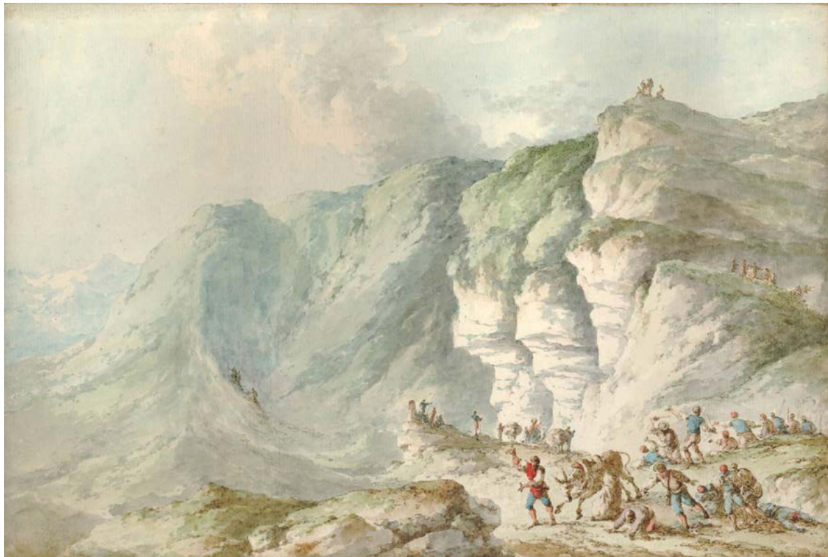
Figura 21. Claude-Louis Châtelet, veduta delle montagne di Alimena, disegno di variante compositiva, penna e inchiostro marrone e nero, acquerello. London, British Museum, inv. 1928,0716.14.