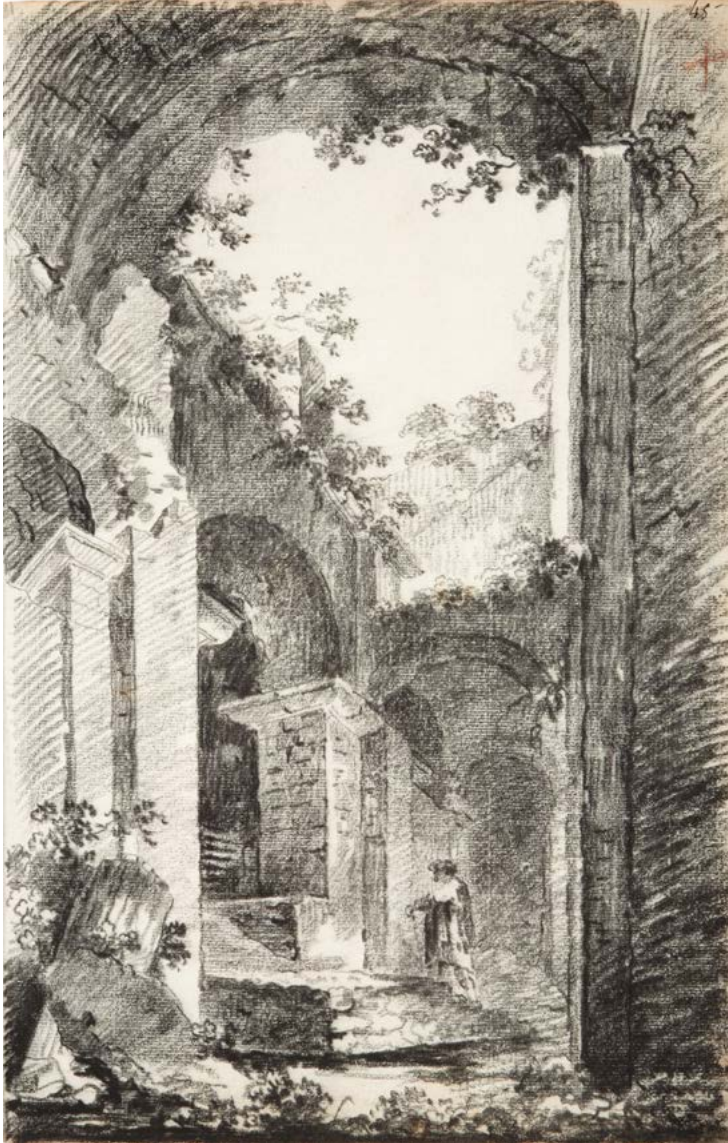
Figura 7. Jean-Augustin Renard, Intérieur de ruine à l'arche (veduta dell'interno dell'antico anfiteatro di Catania), matita nera. Già Galerie De Bayser, Paris, Album du voyage en Sicile , n. 182.