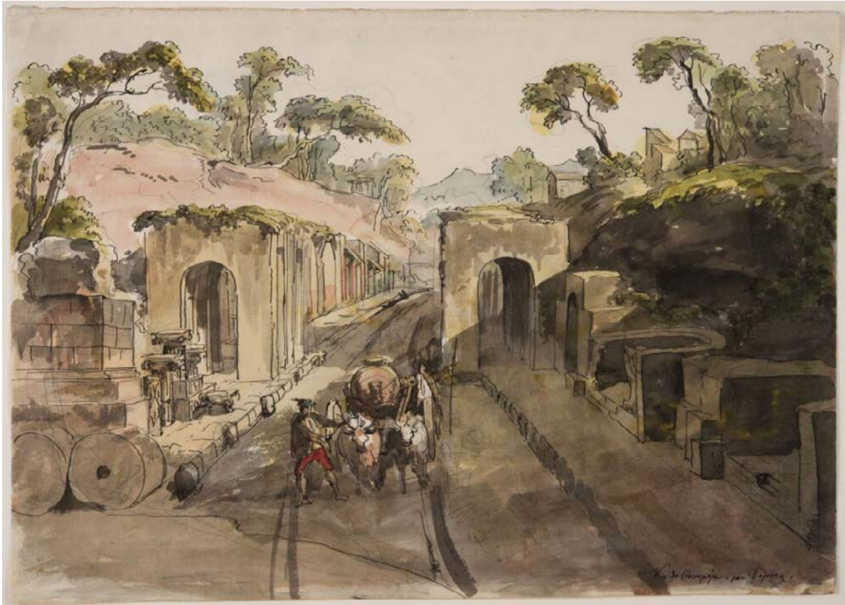
Figura 9. Louis-Jean Desprez, veduta di una porta di Pompei (Porta Ercolana), disegno preparatorio, penna e inchiostro marrone, acquerello. Stockholm, Nationalmuseum, inv. NHM 1756/1875.