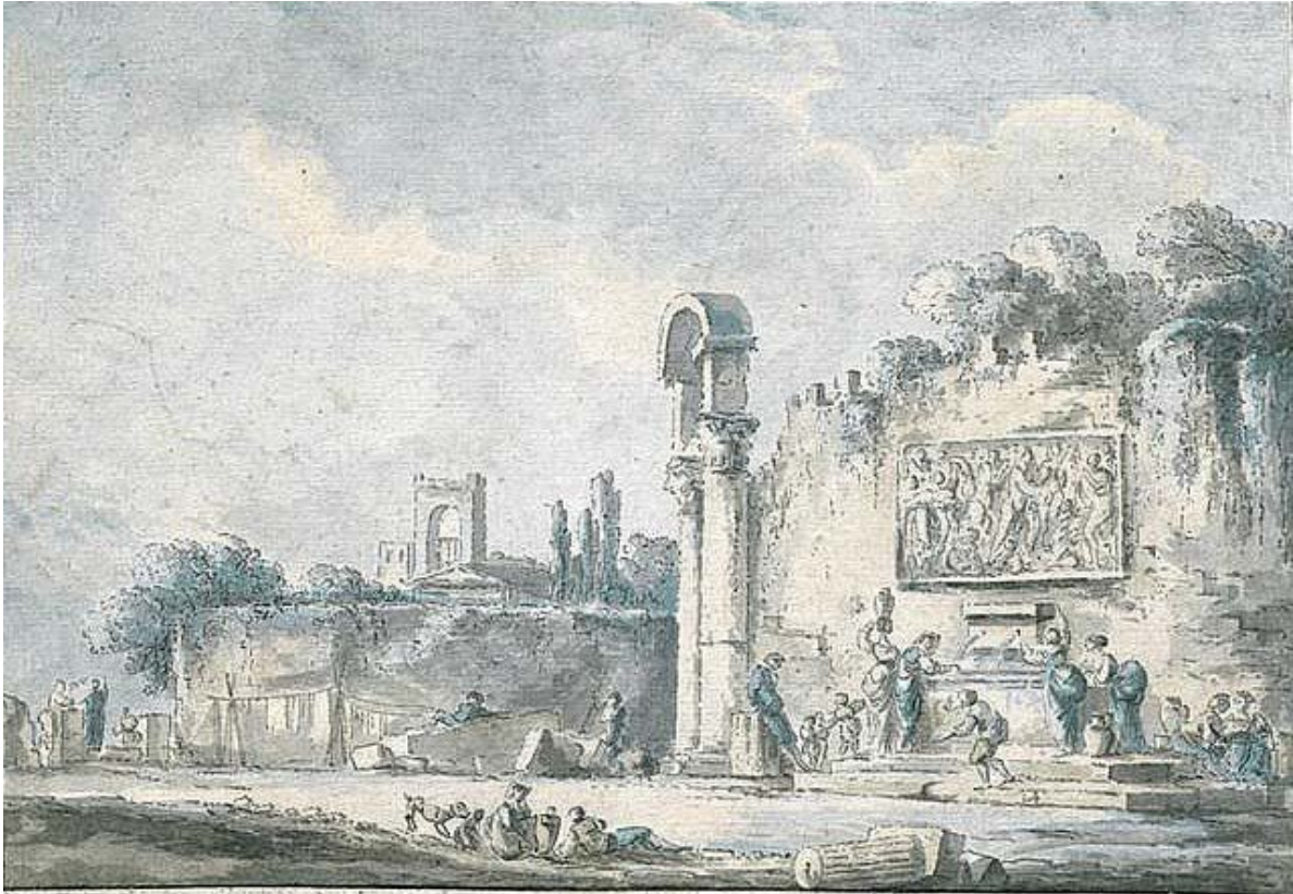
Figura 18. Claude-Louis Châtelet, veduta della fontana di Santa Sofia a Benevento, disegno esecutivo, penna e inchiostro nero, acquerello. Galerie Bassenge, Berlin, vendita 25 novembre 2011, lotto 6298.