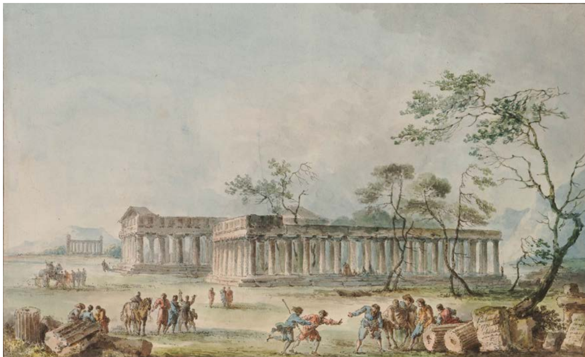
Figura 23. Claude-Louis Châtelet, veduta dei templi di Paestum, variante del disegno esecutivo, penna e inchiostro nero, sanguigna, acquerello. London, British Museum, inv. 1918,0509.1.