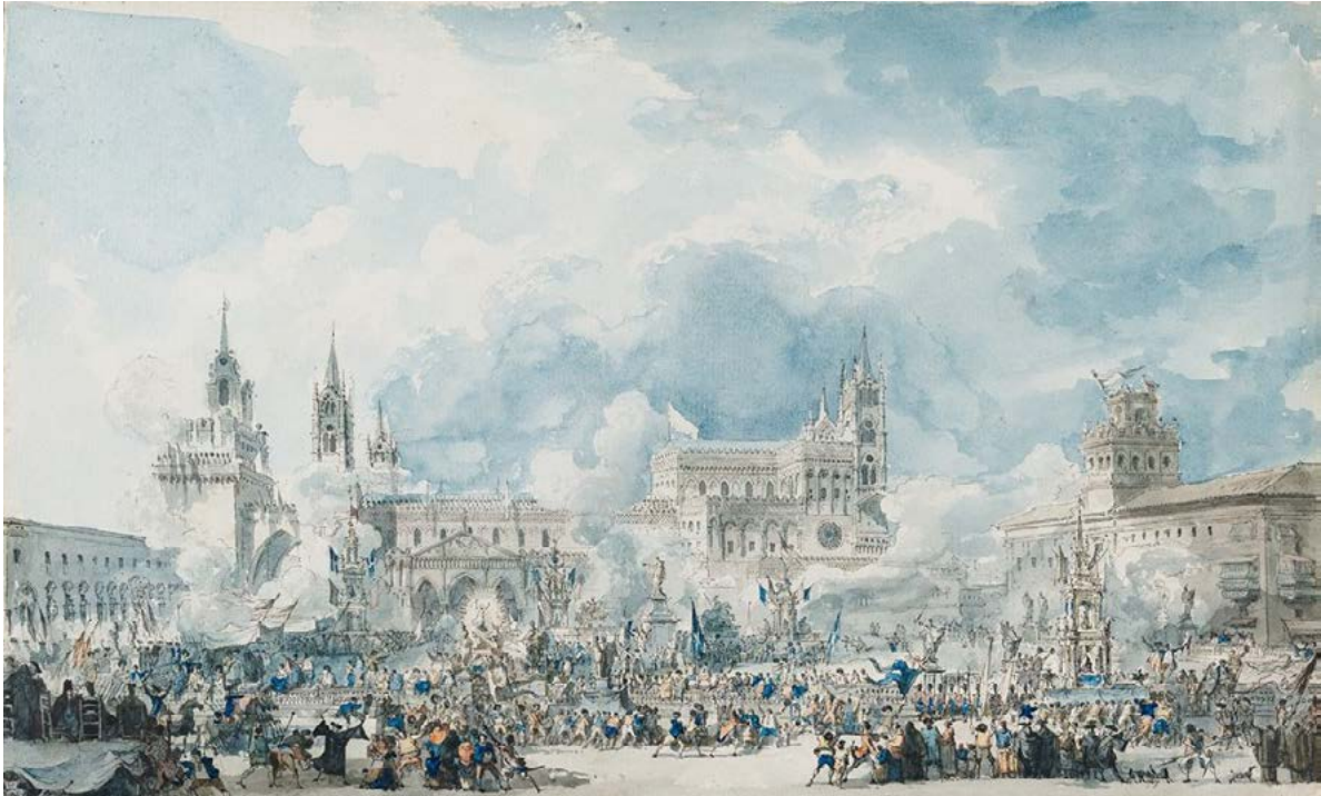
Figura 11. Louis-Jean Desprez, veduta della piazza del duomo di Palermo con la processione di Santa Rosalia, disegno, penna e inchiostro nero, acquerello. Cambridge, Harvard Art Museums/Fogg Museum, 2009.74. https://www.harvardartmuseums.org/art/332230 .