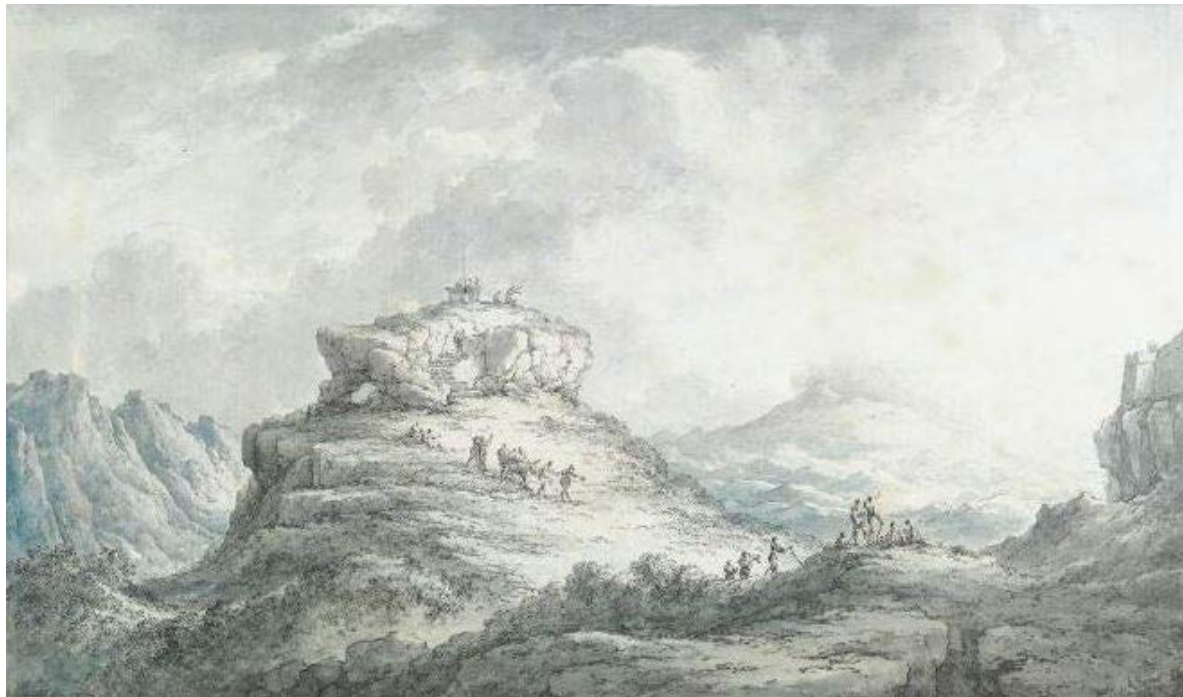
Figura 19. Claude-Louis Châtelet, veduta di Castrogiovanni (Enna) «presso il luogo dove si crede fosse situato il celebre tempio di Cerere», disegno compositivo, penna e inchiostro nero, acquerello. Sotheby's New York, vendita 27 gennaio 2010, lotto 109.