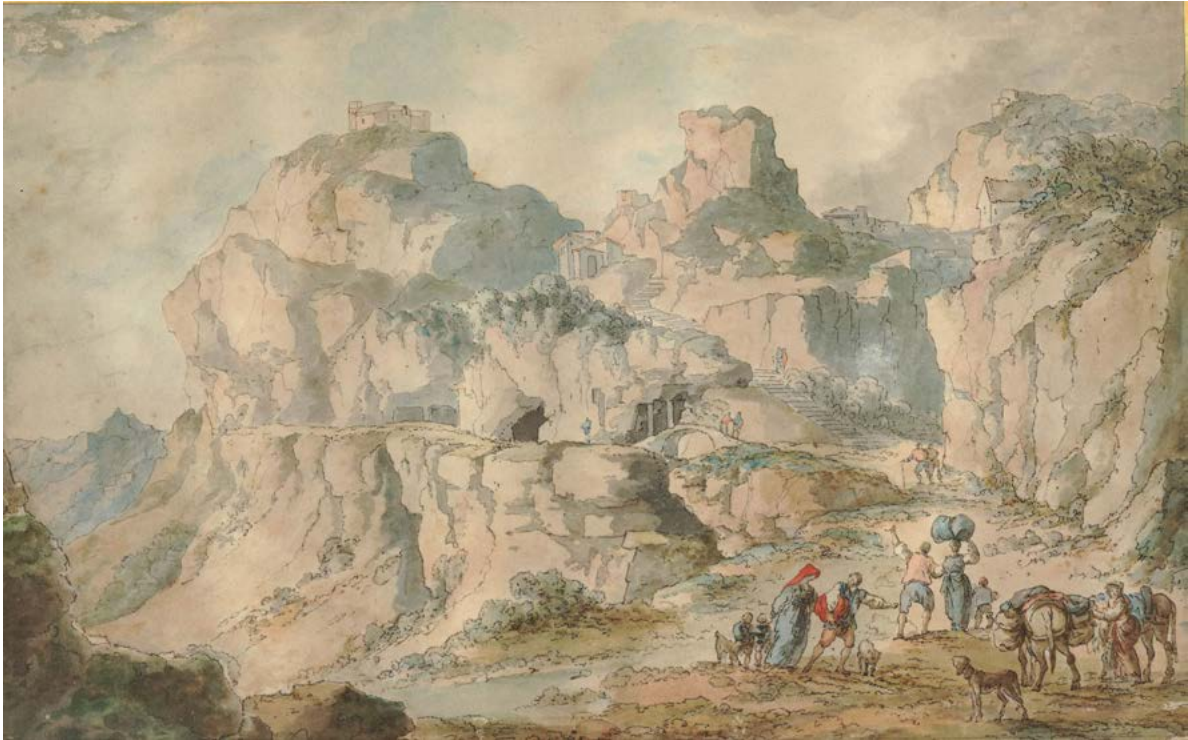
Figura 20. Claude-Louis Châtelet, prima veduta di Castrogiovanni (Enna), replica del disegno esecutivo, penna e inchiostro nero, acquerello. London, British Museum, inv. 1929, 1104.3.