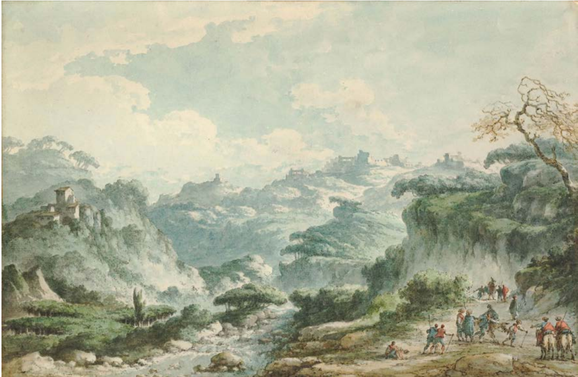
Figura 22. Claude-Louis Châtelet, veduta dei dintorni di Girgenti (Agrigento), replica del disegno esecutivo, penna e inchiostro grigio e nero, acquerello. London, British Museum, inv. 1928,0716.15.