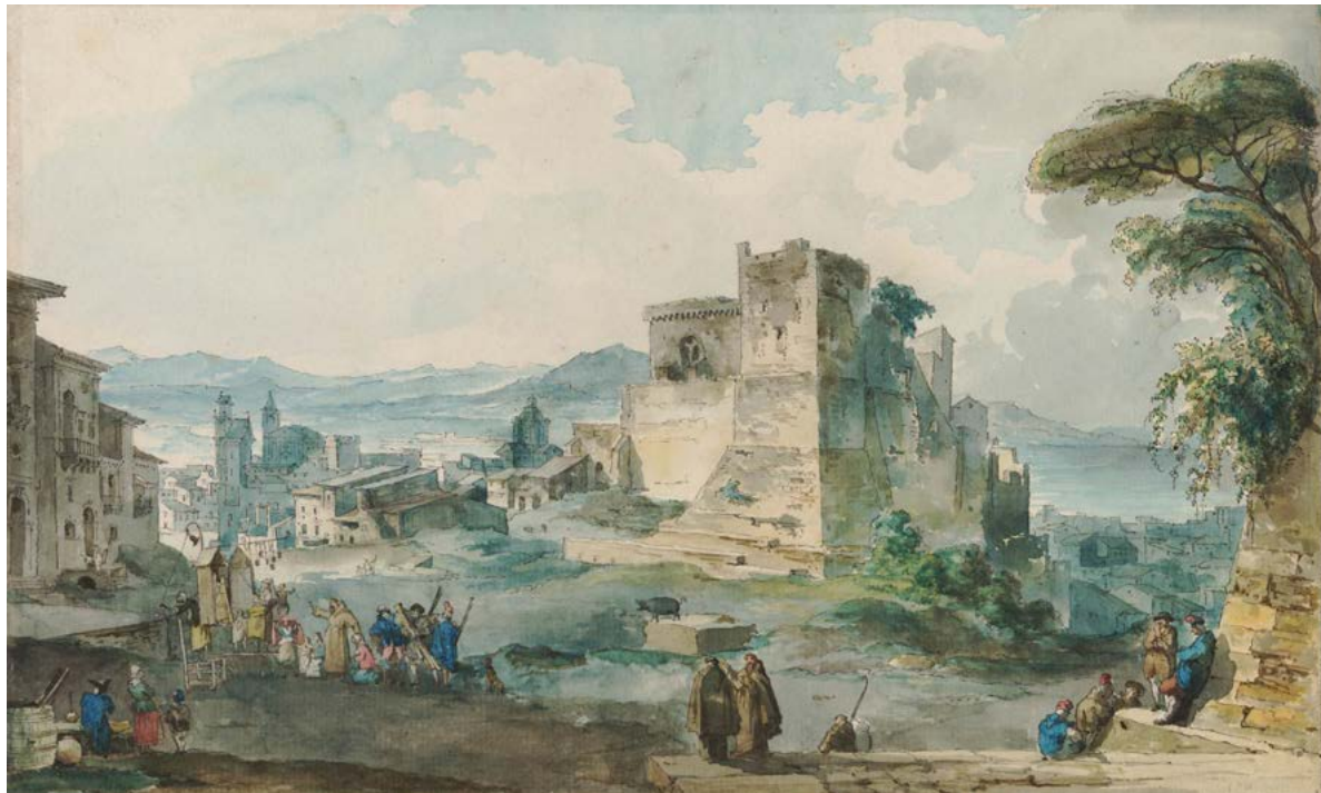
Figura 10. Louis-Jean Desprez, veduta di Alicata (Licata), disegno esecutivo, penna e inchiostro nero, acquerello. London, British Museum, 1861,0810.78.