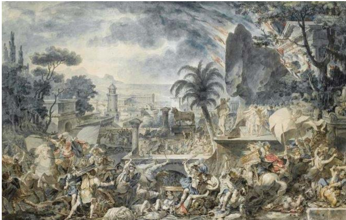
Figura 12. Louis-Jean Desprez, Amilcare attacca la città di Agrigento, disegno, penna e inchiostro nero, acquerello. Già Sotheby's, London, vendita 4 luglio 2007, lotto 135.