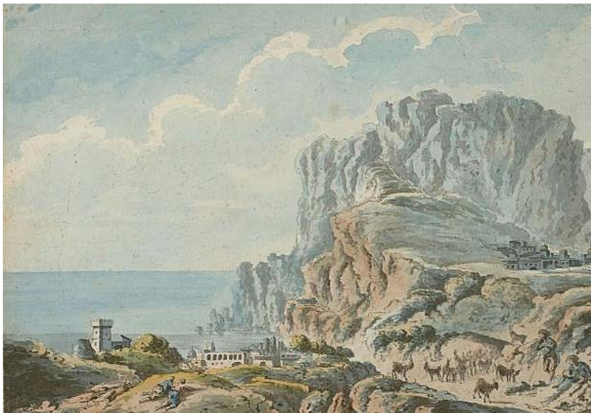
In alto, figura 16. Claude-Louis Châtelet, seconda veduta dell'isola di Capri, disegno esecutivo, penna e inchiostro marrone, acquerello. Artcurial, Paris, vendita 25 marzo 2015, lotto 117; a sinistra, Figura 17. Claude-Louis Châtelet, veduta dell'isola di Capri, variante del disegno esecutivo, penna e inchiostro nero, acquerello. Artcurial, Paris, vendita 3 giugno 2015, lotto 85.