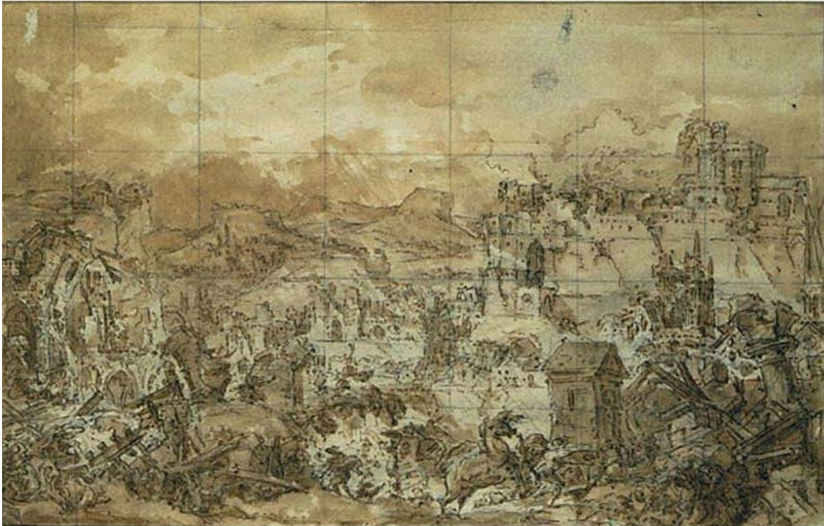
Figura 13. Louis-Jean Desprez, vignetta raffigurante il terremoto di Messina, disegno preparatorio, penna e inchiostro marrone. Stockholm, Nationalmuseum, inv. NHM 51/1874.53.