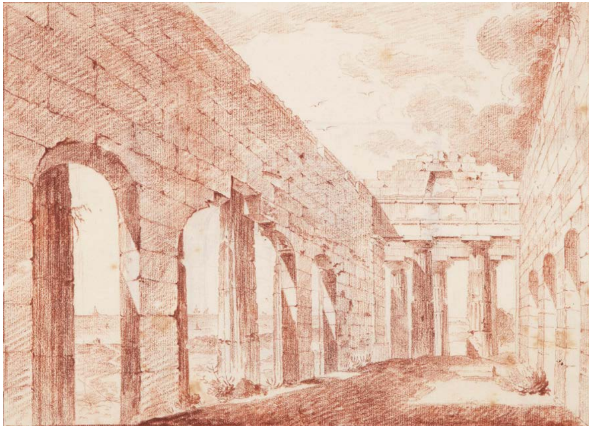
Figura 8. Jean-Augustin Renard, Vue intérieure du temple de la Concorde à Agrigente - 1778, sanguigna. Già Galerie De Bayser, Paris, Album du voyage en Sicile , n. 120.