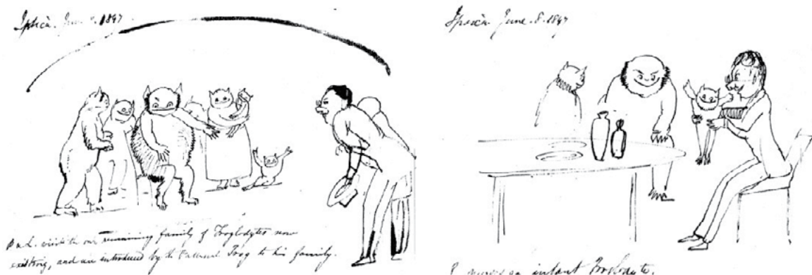
Figure 2-3. Edward Lear, visita alle grotte di Ispica, a sinistra «Ispica. June 8, 1847P. & L. visit the only remaining family of Troglodytes now existing, and are introduced by the Paternal Trog to his family», penna e inchiostro nero; a destra «Ispica. June 8, 1847. L. nurses an infant Troglodyte» ( http://www.nonsenselit.org/Lear/LiS/lis04.html : ultimo accesso 18 ottobre 2010).

giudizio su questi ultimi, riconosco (mie) insormontabili difficoltà pregiudiziali. Con alcune eccezioni lo snobismo savant che si può cogliere in molteplici descrizioni; le non rare cadute di stile – al limite del politicamente scorretto – che connotano buona parte della letteratura del turismo ante litteram tra Settecento e Ottocento sono distanti anni luce dalla raffinata curiosità intellettuale per i selvaggi di un Montaigne o dalla spietatezza antropologica di uno studioso siciliano come Serafino Amabile Guastella (1819-1899).