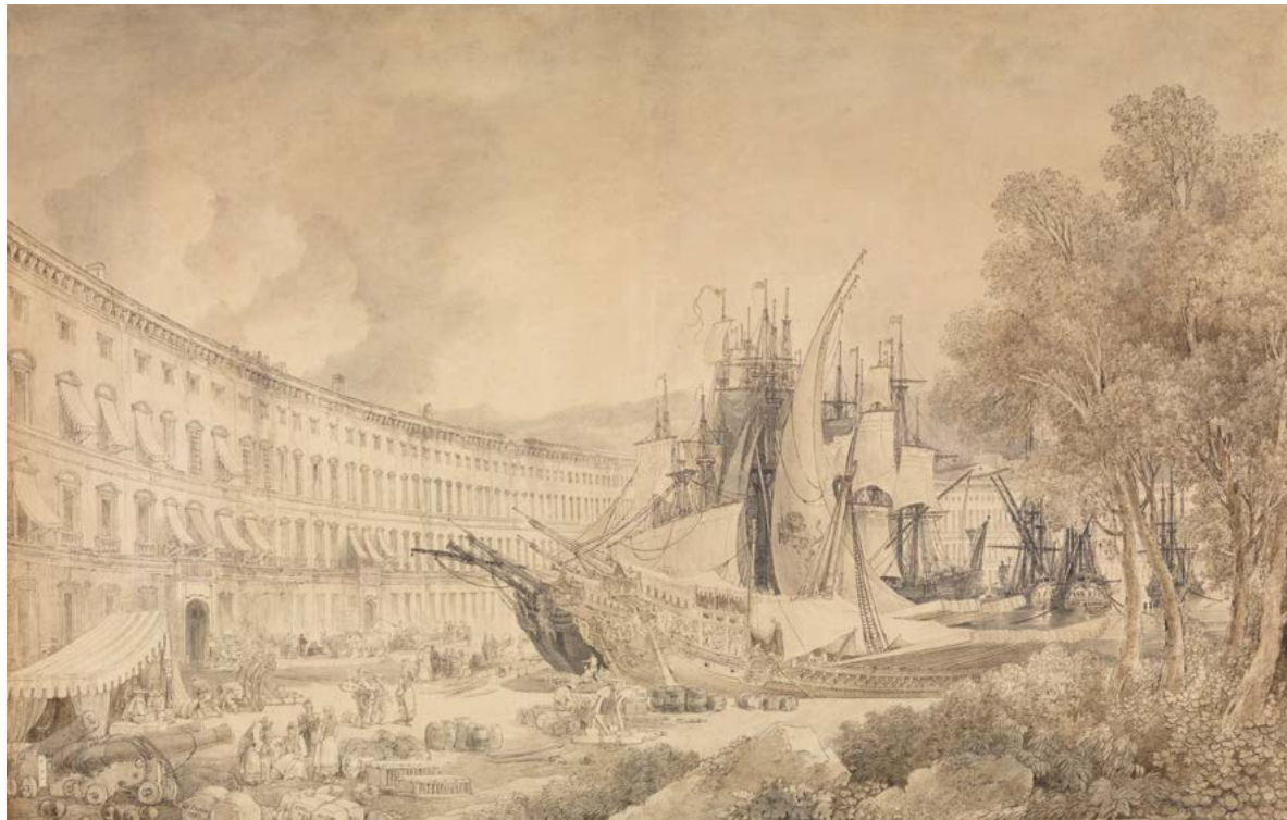
Figura 1. Louis-François Cassas, veduta del porto di Messina, 1783, penna e inchiostro nero e marrone, acquerello. New York, The Metropolitan Museum, Harry G. Sperling Fund, 2013, 2013.519.