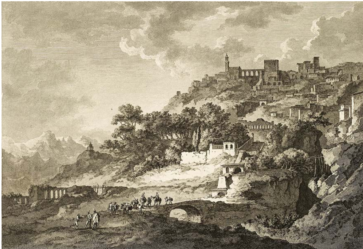
Figura 9. Claude-Louis Châtelet, Vuë Generale de la Ville de Leon Forte , incisione di Pierre-Michel Alix (SAINT-NON 1781-1786, IV.I, 1785, n. 47).