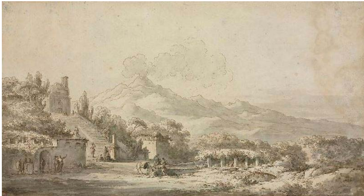
Figura 4. L'Etna visto dalla casa dei Cappuccini a Trecastagni, variante compositiva del disegno esecutivo, penna e inchiostro bruno, acquerello. Già London, James Cohan Gallery, The Fifth Season Group Exhibition, 24 giugno-8 agosto 2014.